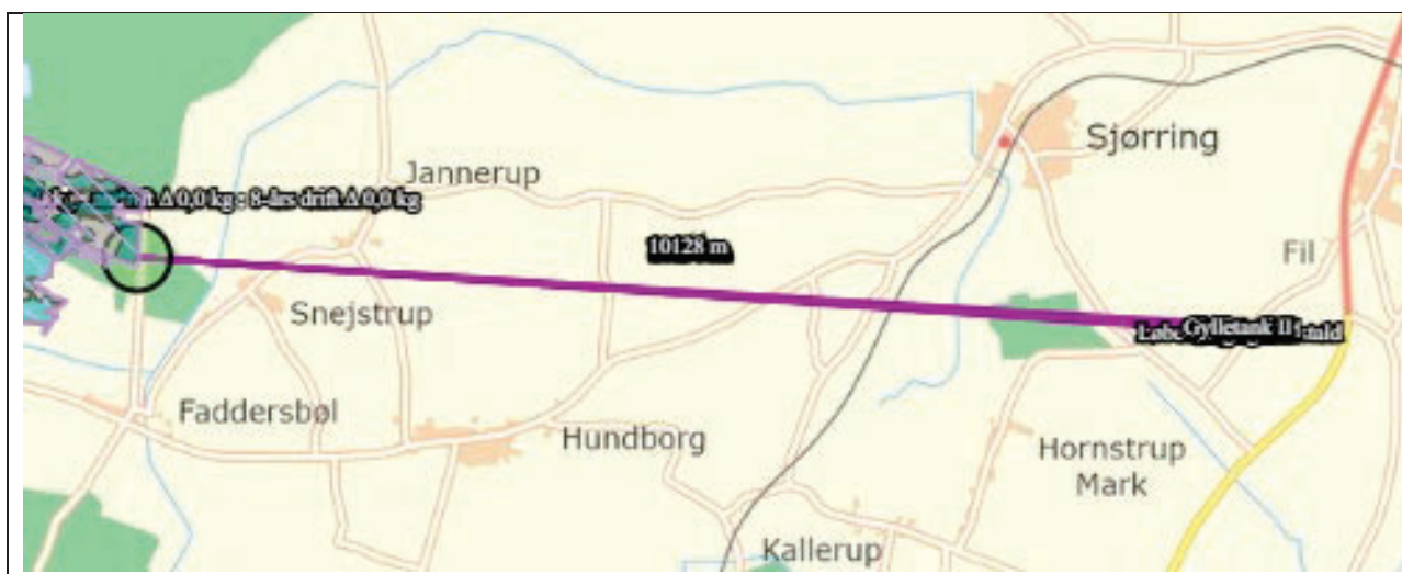
Nærmeste kategori 1-natur

Der er ikke vurderet på kumulation, da det mest skærpede beskyttelsesniveau for kategori 1-natur er overholdt (0,2 kg NH 3 -N/ha/år), det vil sige beskyttelsesniveauet, hvor der er kumulation med 2 eller flere husdyrbrug. Dermed er depositionskravet for kategori 1-natur overholdt.