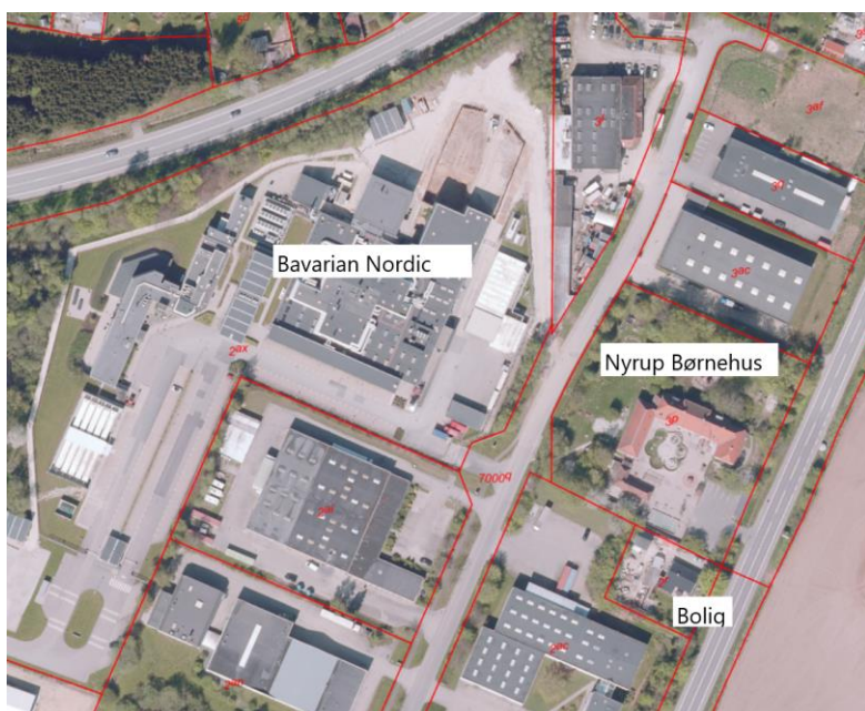
Figur 1 Beliggenhed af Nyrup Børnehus (matr. 3P) og bolig matr. 2f

Ved i anvendelsesbestemmelserne at anføre, at der kun kan drives daginstitution på matriklen, vil dette give mulighed for, at virksomhedens støjgrænser kan lempes med hjemmel i Miljøstyrelsen vejledning nr. 3 2003 "Ekstern støj i byomdannelsesområder", afsnit 5 (supplerende bemærkninger til vejledende støjgrænser):