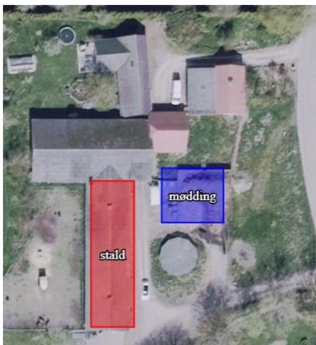
Figur 1 – Anlægstegning. Staldafsnit er markeret med rød og møddingsplads er markeret med blå.

Der ønskes etableret en hestepension på husdyrbruget samt lidt hobbyhøns. Der er, jævnfør husdyrbruglovens § 9 stk. 1, ansøgt om dispensation efter husdyrbruglovens § 6 stk. 1, fra afstandskrav til naboskel samt til nabobeboelse, da produktionsarealet indrettes i eksisterende bygninger på ejendommen, hvor der oprindeligt har været stald til kvæg og svin. Der opføres således ikke nybyggeri i forbindelse med ansøgningen, da der i forvejen er bygninger på ejendommen, der er velegnede til formålet. Placering af husdyrbrugets stald- og gødningsanlæg fremgår af Figur 1.