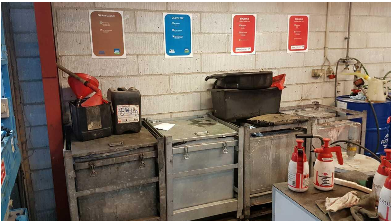
Opbevaring af farligt affald i ABAS-beholdere.