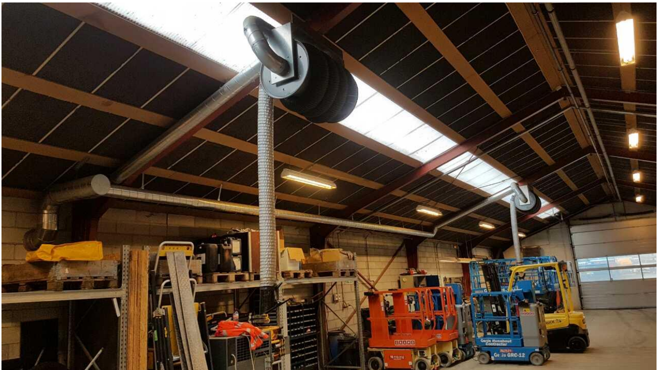
Værkstedssudsugninger for svejserøg og udstødningsgas.