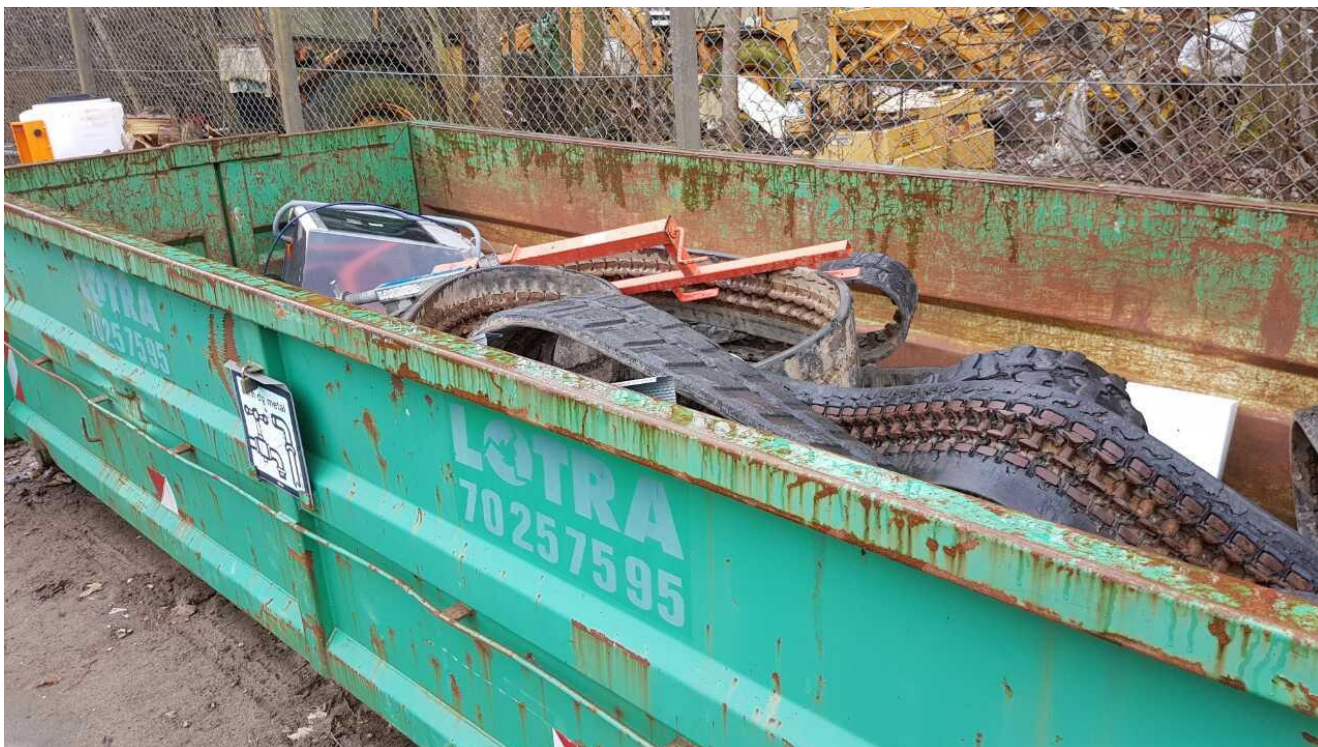
Åben container til metalskrot.