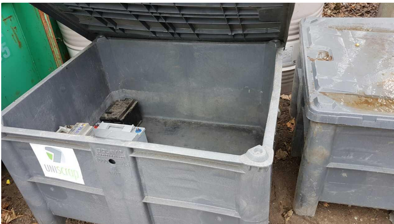
Akkumulatorer opbevares i plastkasse med låg.