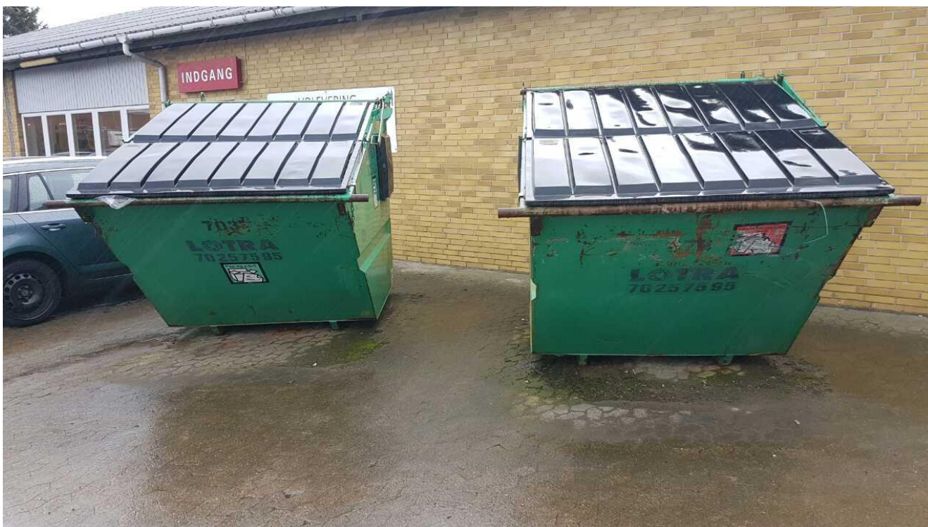
VIP-containerer til henholdsvis papir/pap og brændbart erhvervsaffald.