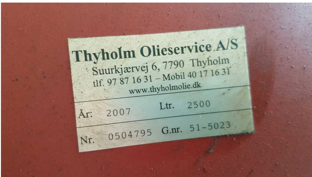
Tankplade på dieselolietank.