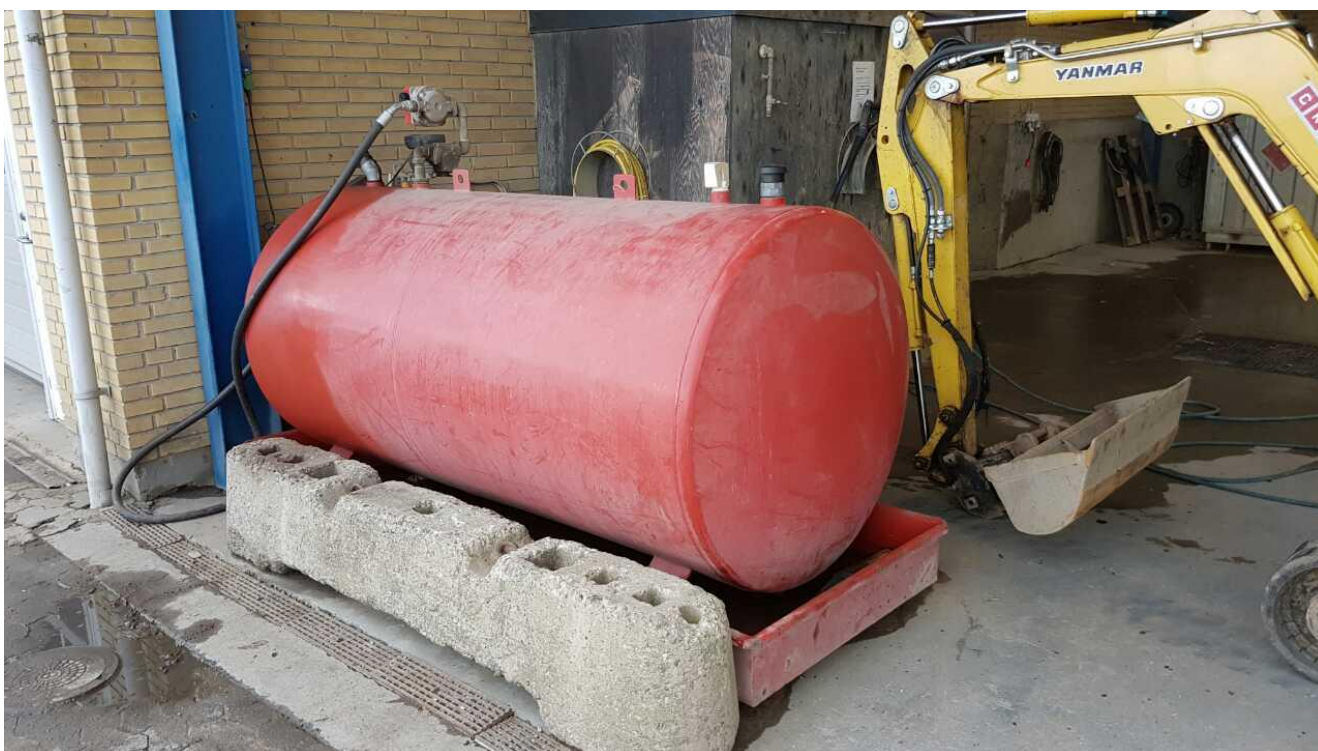
Tankningsplads for dieselolie.