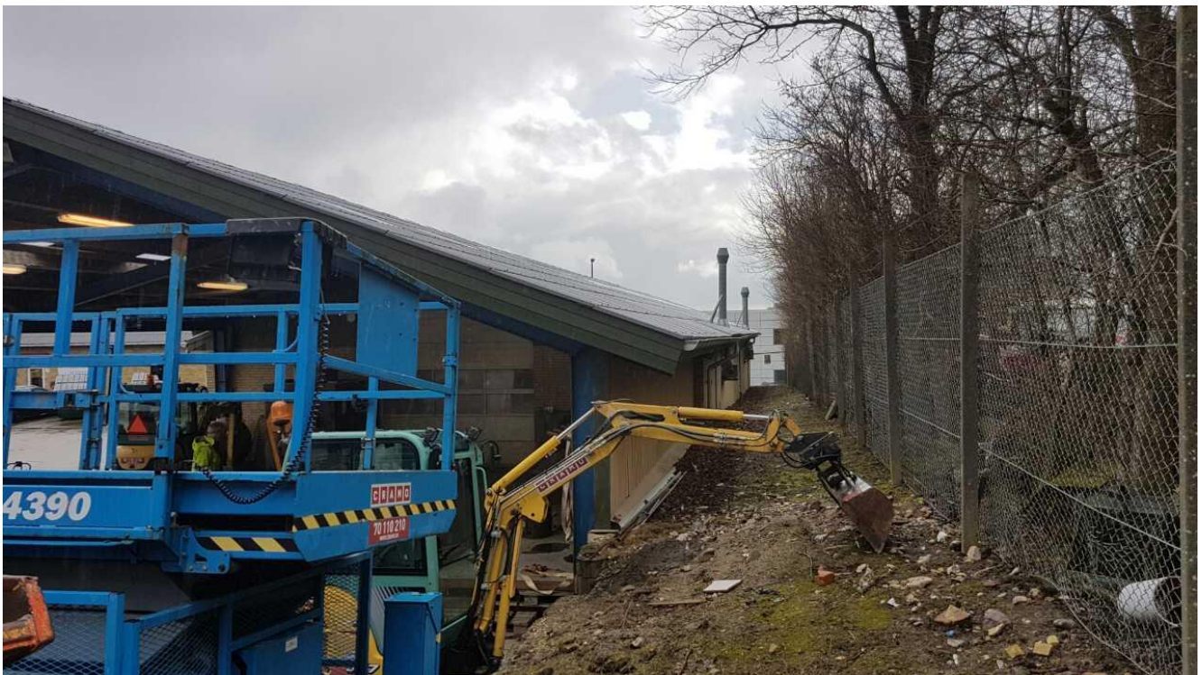
To stk. afkast fra værkstedssudsugninger for svejserøg og udstødningsgas.