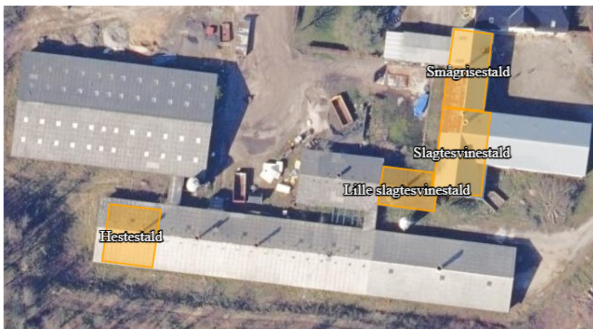
Figur 1. Oversigt over staldanlæggets placering på Bovrup Kirkevej 65, 6200 Aabenraa

Der har tidligere været yderligere tre staldafsnit med henholdsvis 8 DE søer, 20 DE søer og 48,6 DE smågrise (7,5-30 kg), som ikke længere er i brug. Disse staldafsnit udgår i det anmeldte.