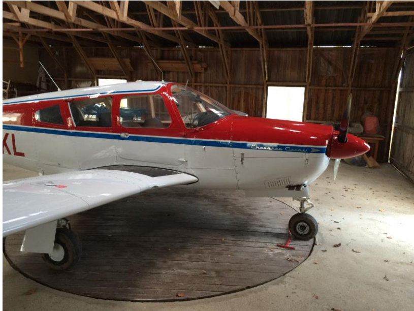
Tømrerfirmaets eget fly (Piper PA-28R OY-BKL) i hangar på pladsen (billede fra 2015).