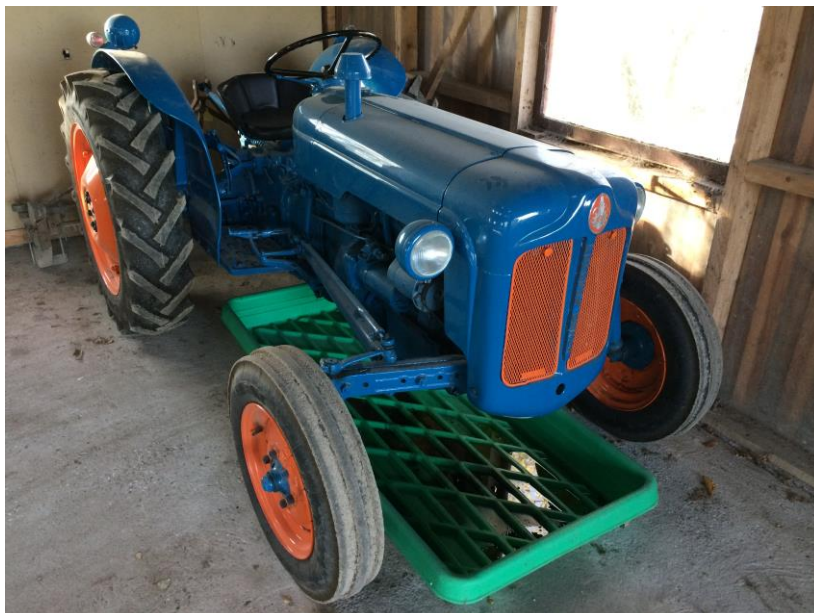
Spildbakke under traktor

Der oplagres en begrænset mængde af motorolie, rudepudsemiddel mv. til flyet i hangaren på fast betongulv uden afløb. Flyet anvender som brændstof AVGAS 100LL, der fortrinsvis tankes i Aarhus Lufthavn. Der opbevares ikke andet brændstof på flyvepladsen end den mængde, som flyets tanke indeholder.