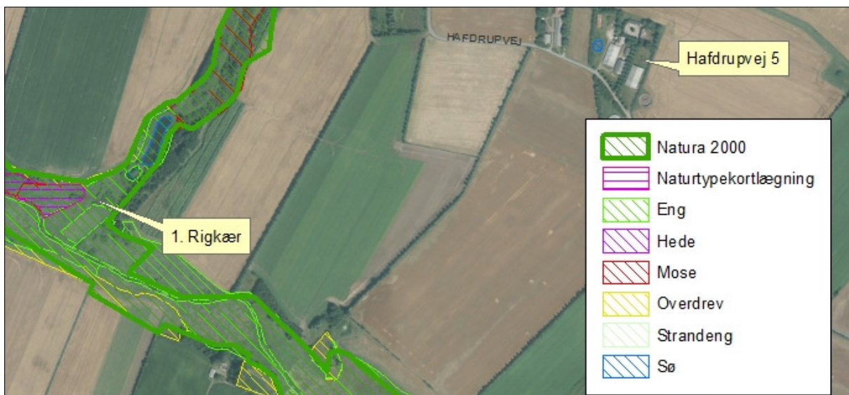
Figur xx. Kategori 1 naturområder ved anlægget

Nærmeste Natura 2000-område er nr. 91 (habitatområde nr. 80) – Kongeåen - ca. 700 m nordvest for anlægget.