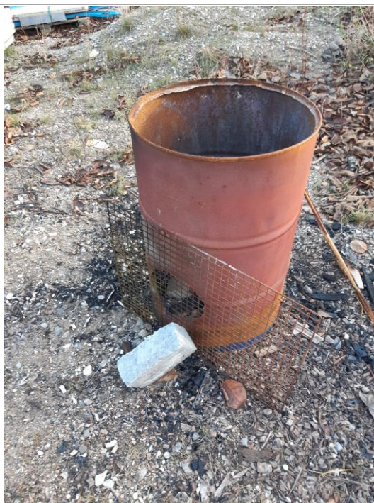
Afbrænding af affald