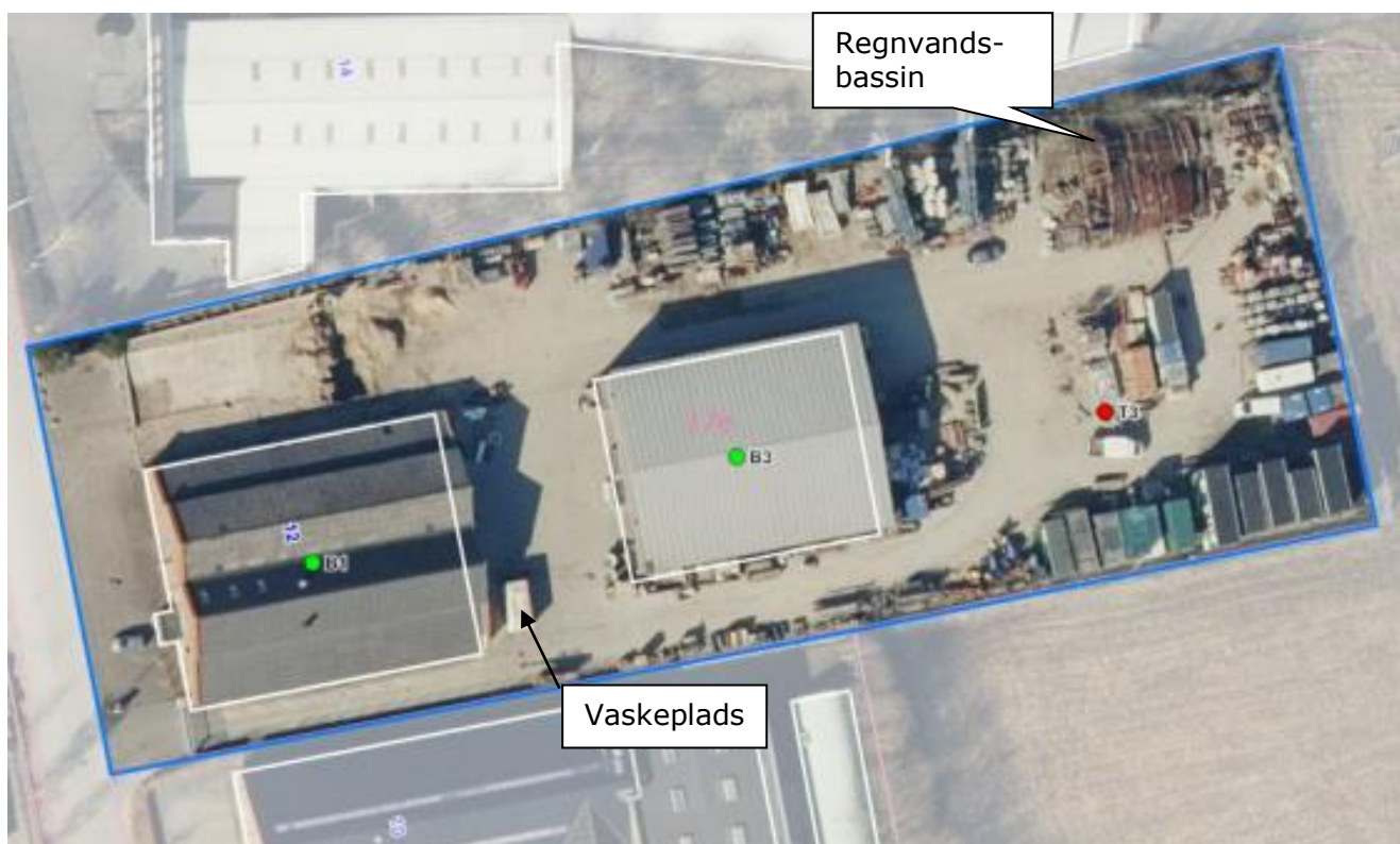
Luftfoto af virksomheden med matrikelskel anno 2021

Virksomheden ligger i erhvervsområdet 240504ER i henhold til kommuneplanen. Virksomheden ligger i et område med særlige drikkevandsinteresser (OSD-område), men der er p.t. ingen drikkevandsboringer i området. Nedenstående luftfoto viser virksomhedens arealmæssige afgrænsning på matriklen.