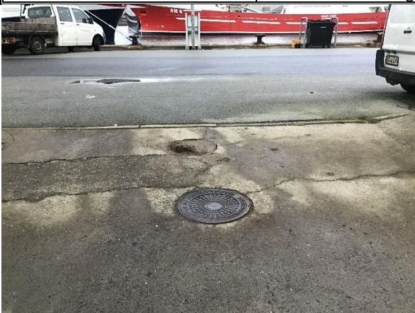
Sandfang og olieudskiller