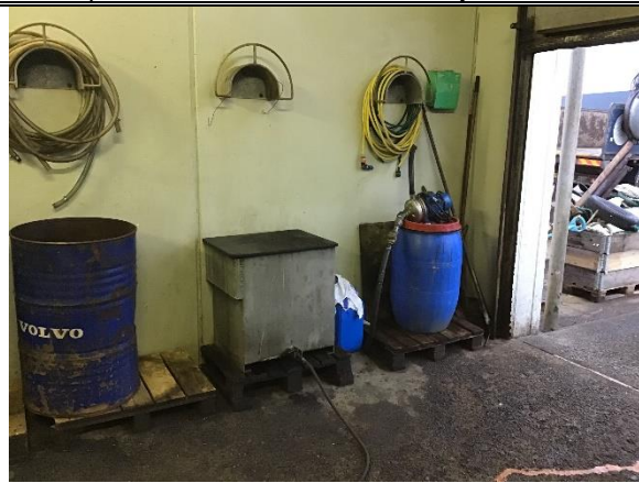
Rensekar i renserum