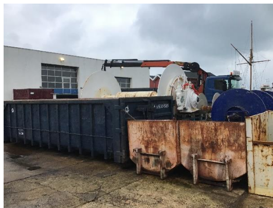
Oplag af forskelligt affald på udendørs plads