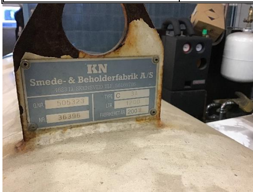
Pejleplade på tank i værksted.