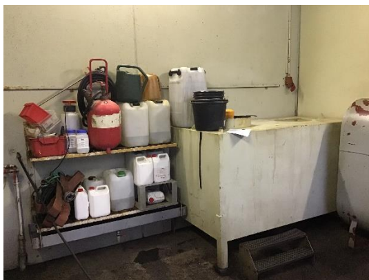
Spildolietank i dampserum