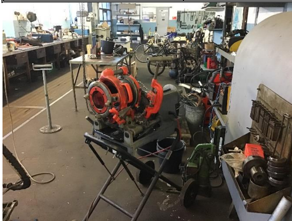
Gevindskærer med skæreeolie