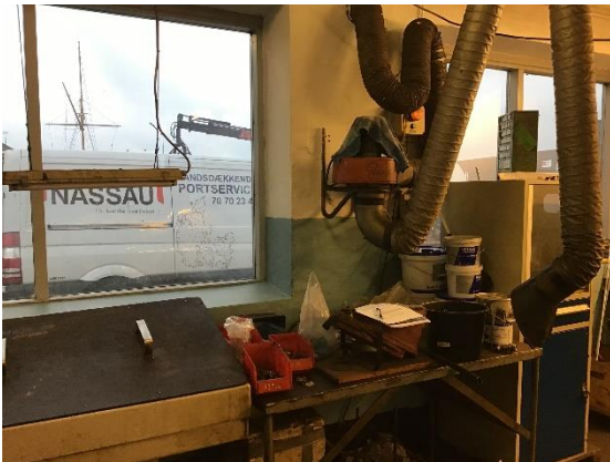
Rensekar med tilhørende udsugning