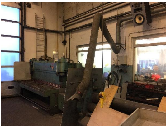
Udsugninger i skæreværksted