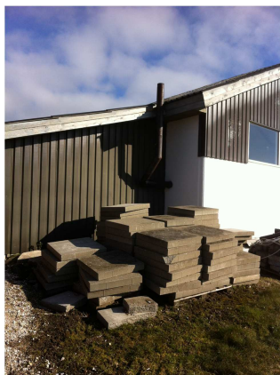
Afkast fra smøregrav