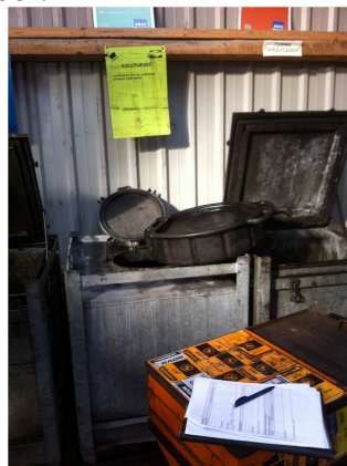
Beholdere med diverse væsker