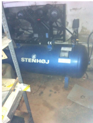
Kompressor i værkstedet

Der er umiddelbart ikke nogen støjgener fra virksomheden.