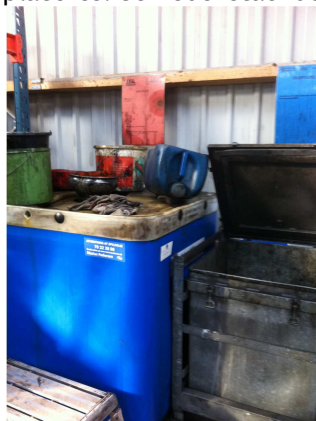
Beholdere med diverse væsker

Der var sat sedler ved hver beholder, således at det nemt kunne ses, hvor de enkelte væsker skulle placeres. Se nedenstående 2 billeder.