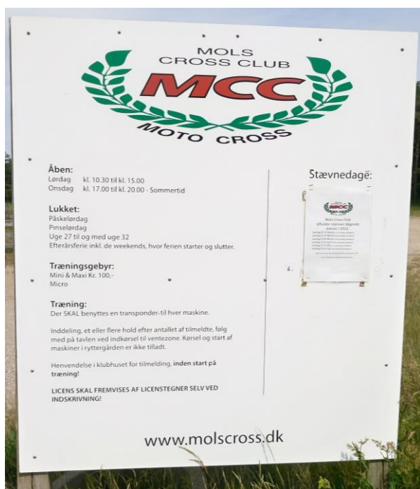
Billede nr. 1: Opslag med åbningstider og løbsarrangementer