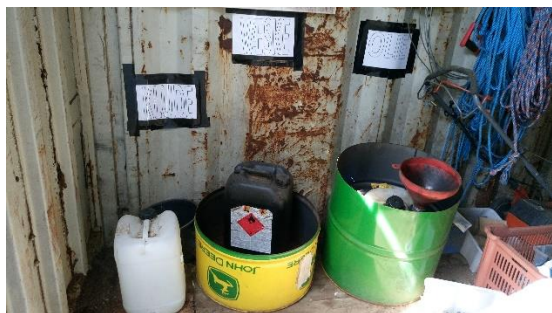
Billede nr. 2: Opbevaring af affald

Spildolie og andre væsker opbevares i dunke, som er placeret i tromler. Containeren med farligt affald er aflåst uden for åbningstiden.