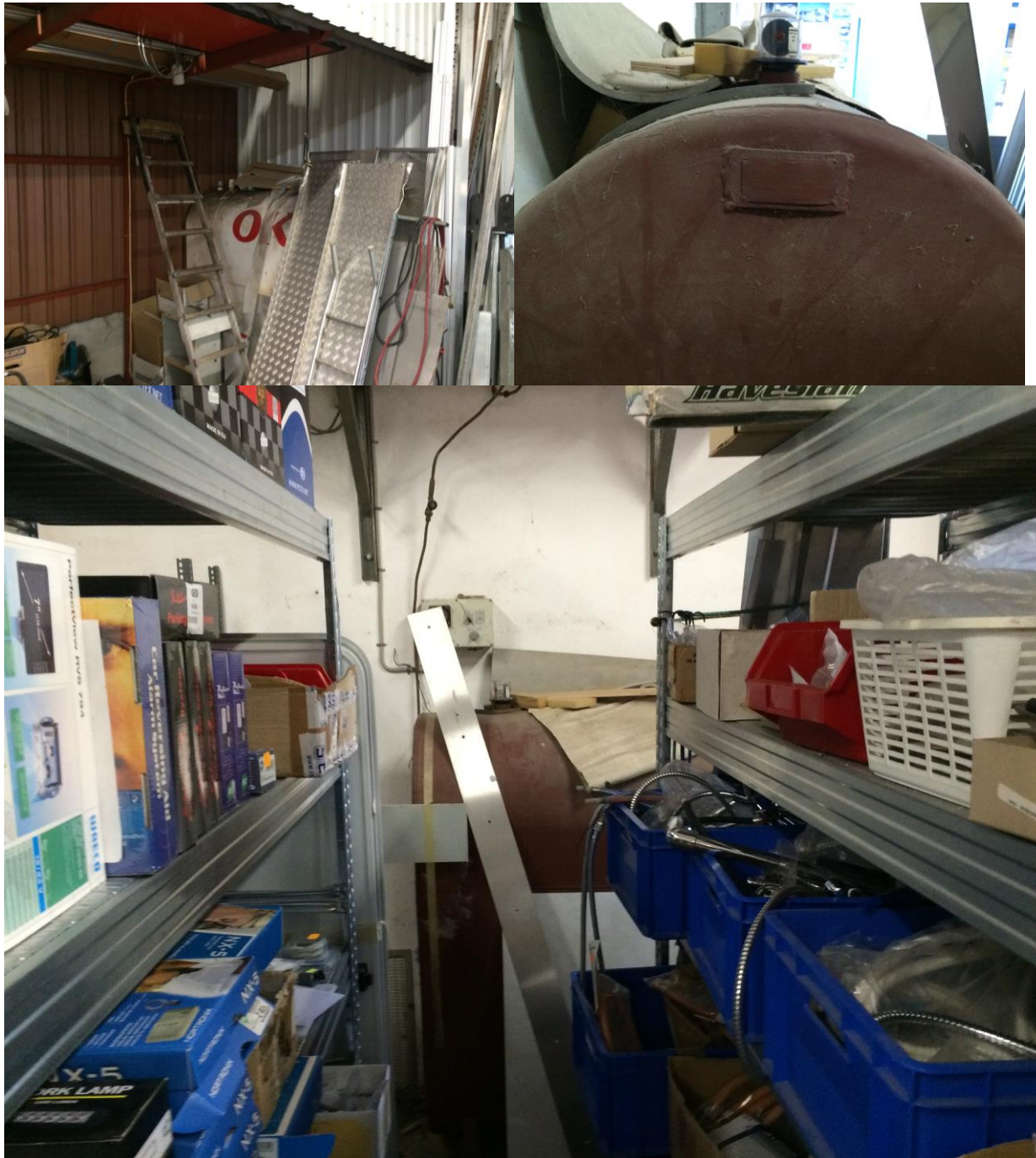
Billeder af utilgængelige og uidentificerbare tanke.