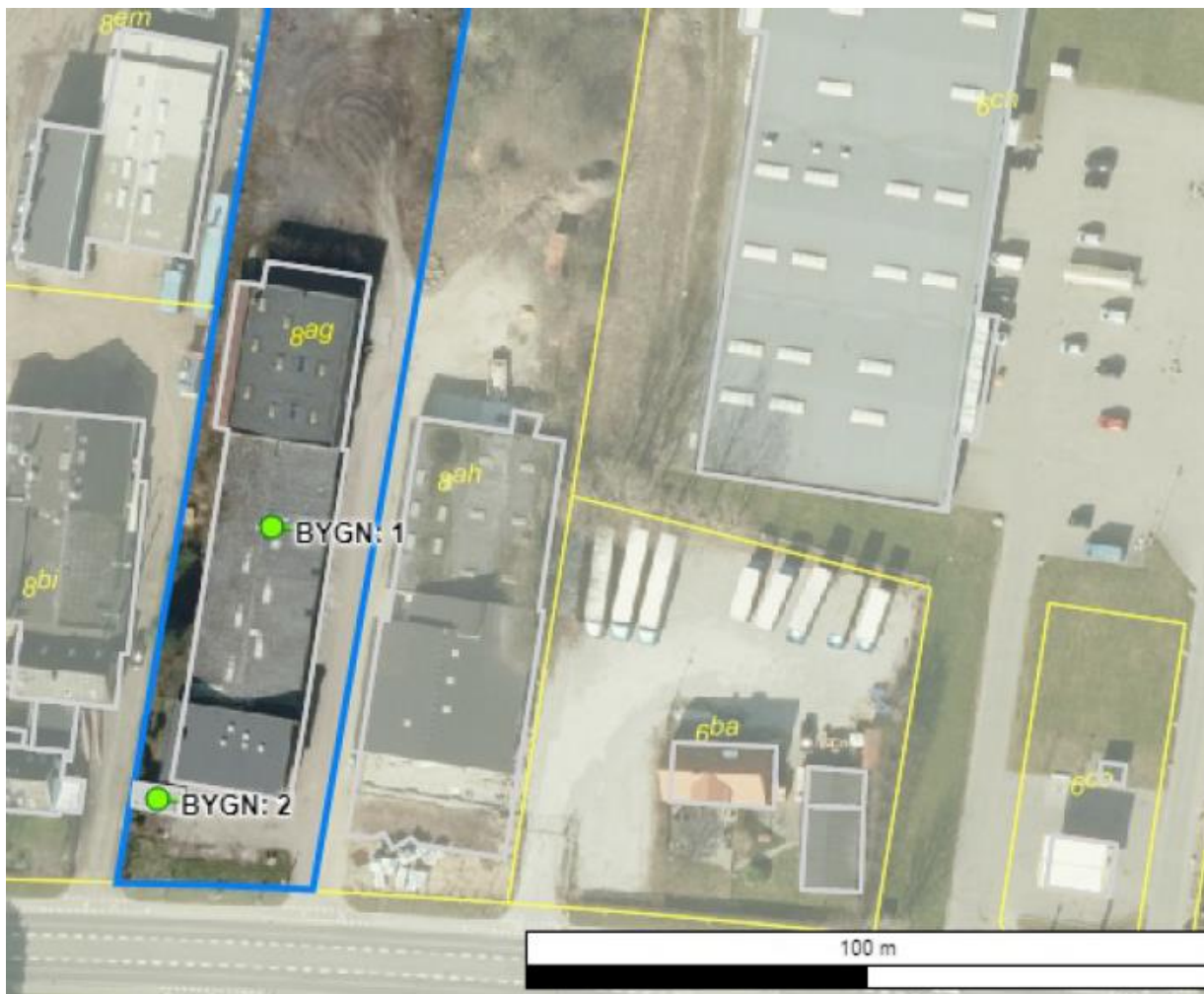
Luftfoto af virksomhedens beliggenhed med matrikelskel

Virksomheden ligger i et erhvervsområde 240102ER på matr. 8 ag Brabrand by, Brabrand – se nedenstående matrikelkort. Virksomheden er indrettet i den nordlige del af bygningen på adressen (bygning 1). Virksomheden bor til leje på adressen.