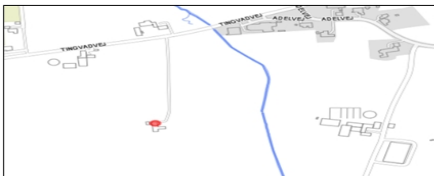
Bilag 1: Kortet viser beliggenheden af Tingvadvej 6, 6500 Vojens