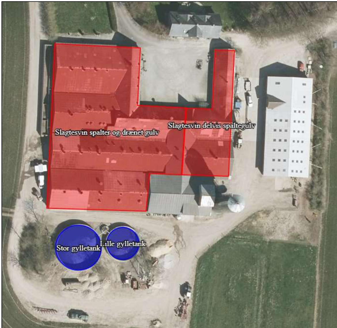
Figur 2 Staldenes og gyllebeholdernes placering på Mejlbyvej 10, den Lille gylletank er taget ud af brug.