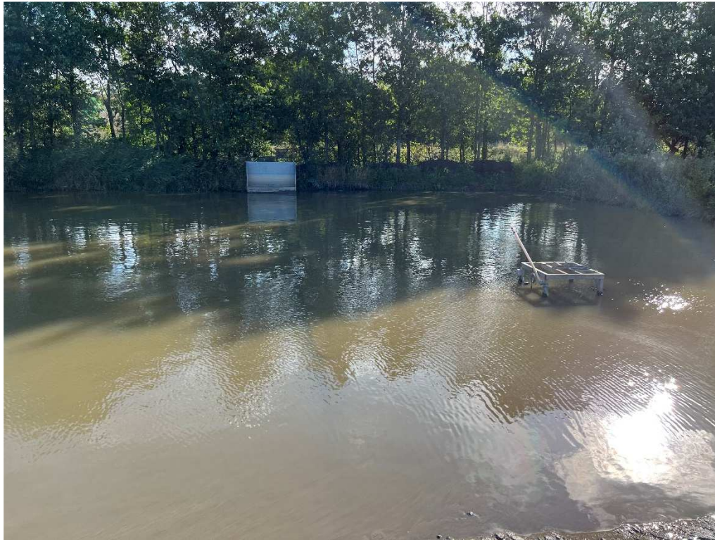
Billede 2: Bagkant forstærkning af bassinet er fortaget med rent ler, og efterfølgende afdækning med et mundlag.