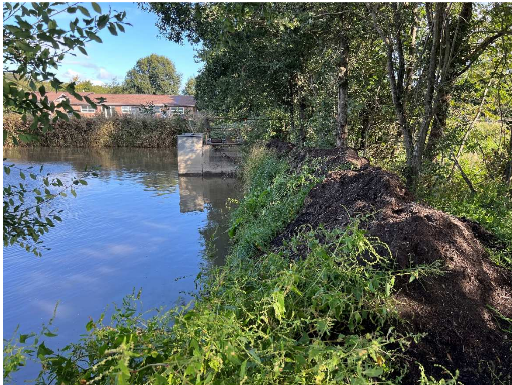
Billede 1: Bagkant forstærkning af bundfældningbassin til overfladevand er forhøjet med 1,5 meter i forhold til den højde bassinet havde i marts 2022.

Tilsyn den 18. september 2023 var en drøftelse af virksomhedens ønske om en ny miljøgodkendelse indenfor lokalplan 705. Temaet for mødet var tiltag til sikring af at Alling Å blev beskyttet mod spildevand fra virksomheden, grundet den store politiske interesse på området. En gennemgang af virksomheden vist ikke overskridelser af vilkår.