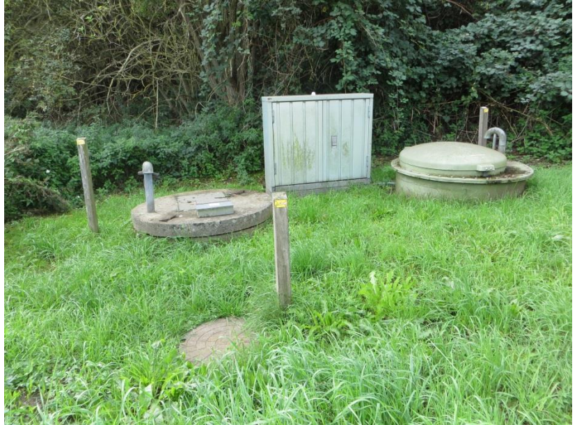
Foto 2 Påkørt perkolatbrønd S1