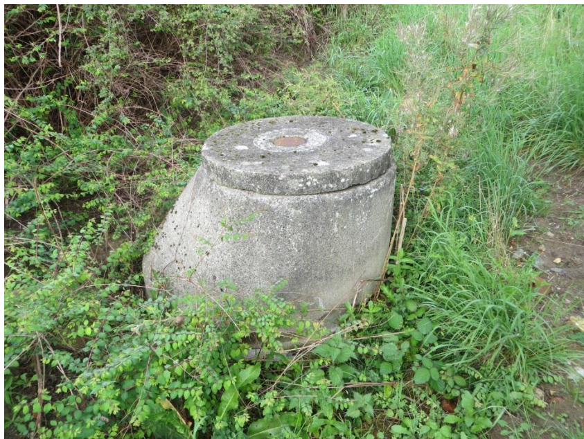
Foto 4 Trial MC klub