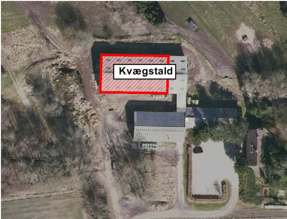
FIGUR 1 PLACERING AF STALDANLÆG