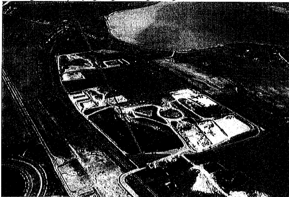
Tegning over pladsens indretning

Placering af den nye oplags- og sorteringsanlæg