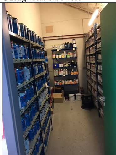
Oplag af farver