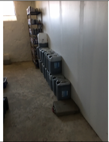
Brandsikret rum i kælderen