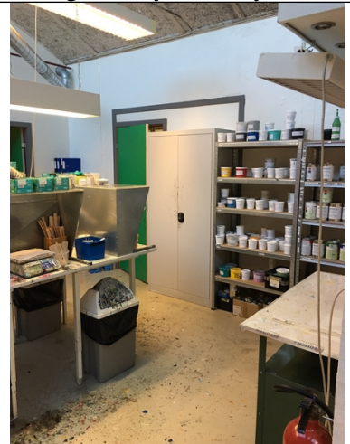
Oplag af farve/kemikalier