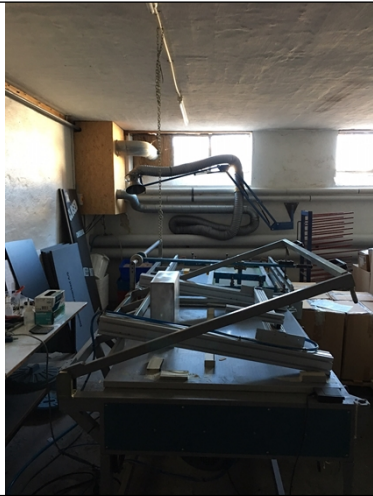
Udsugning i kælderen