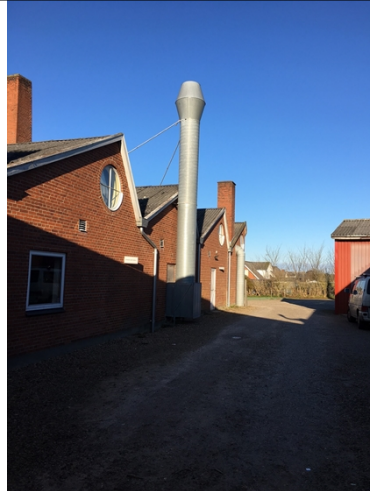
10.000 m 3 genveksanlæg