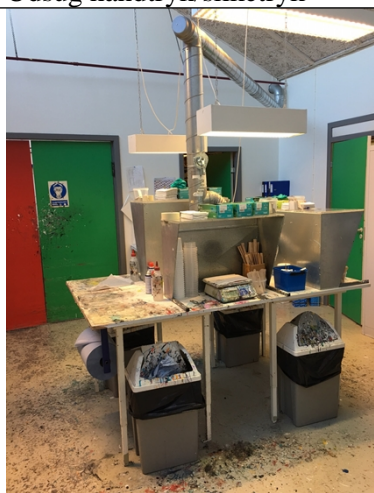
Bortskaffelse af farver