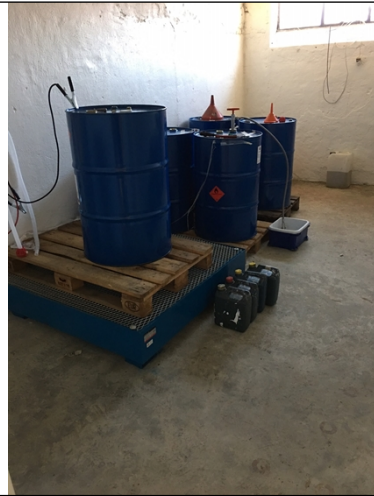
Brandsikret rum i kælderen