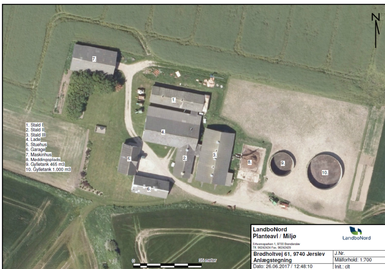
Figur 1. Anlægstegning for Brødholtvej 61

Afstanden fra egen vandboring på Brødholtvej 61 til staldene er mindre end de 25 m, der er afstands-kravet i husdyrgodkendelsesloven. Brønderslev Kommune dispenserer fra afstandskravet til egen vandboring, jf. § 9, stk. 3 i husdyrgodkendelsesloven, da der er tale om eksisterende bygninger, og da det ansøgte projekt ikke vurderes at medføre væsentlige gener sammenlignet med den eksisterende produktion.