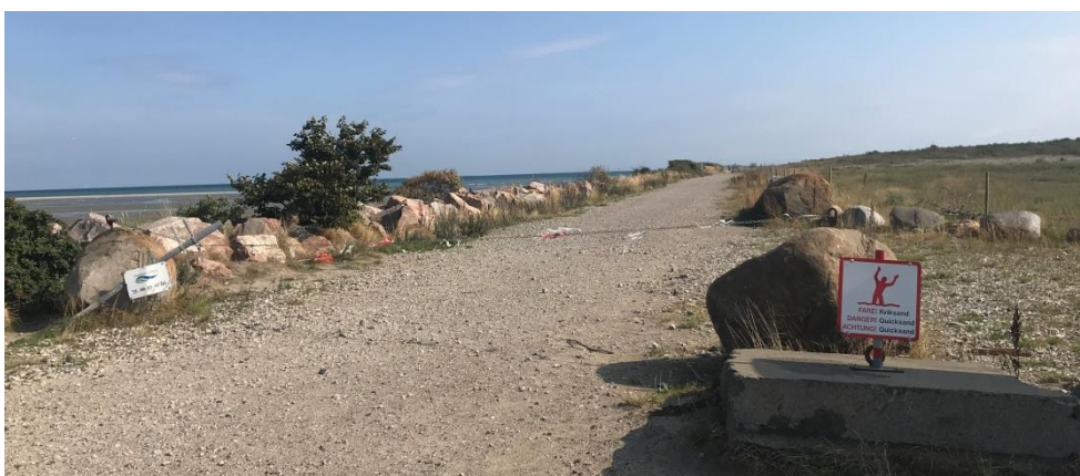
Foto 3. Indgang ved nord-vestlige hjørne af depotet. Afspærring med kæde.

Depotafsnit 4 har angiveligt en restkapacitet på 95.000 m 3 . I det nordvestlige hjørne af deponiet var der to indgange. Den ene indgang var afspærret med kæde (foto 3). Ved den anden indgang var kæden taget af (foto 4). Frederikshavn Havn oplyste, at dette skyldtes arbejde på anlæggelse af havneudvidelse ved siden af deponiet. Det blev oplyst, at indgangen blev afspærret med kæde hver dag ved arbejdets ophør.