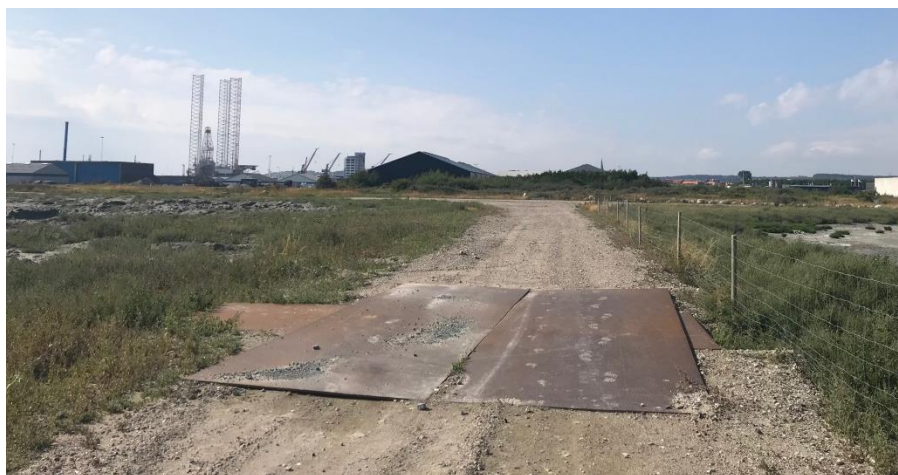
Foto 9. Udgravet forbindelse mellem depotafsnit 3 og 4.

Ved høj vandstand har virksomheden tidligere konstateret, at der potentielt kan strømme overskudsvand fra især depotafsnit 3 til nærliggende virksomheder. De har derfor udgravet en forbindelse mellem afsnit 3 og 4, således at overskudsvand fra afsnit 3 kunne strømme til afsnit 4, i stedet for at oversømme det nordvestlige hjørne af området (se foto 9).