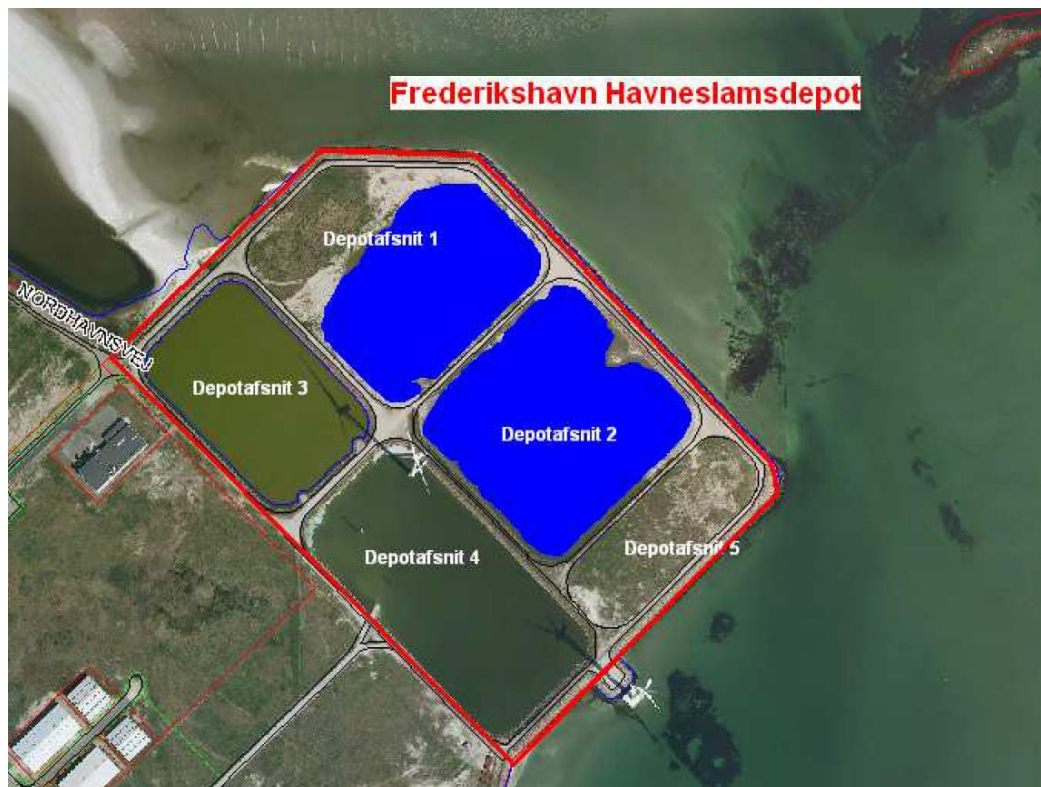
Figur 2. opdeling af Havnesedimentdepotet.