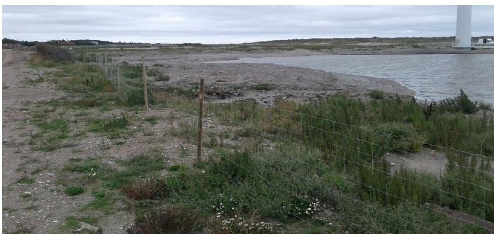
Foto 7, fremsendt den 31. august 2018. Opsat hegn ved depotafsnit 4