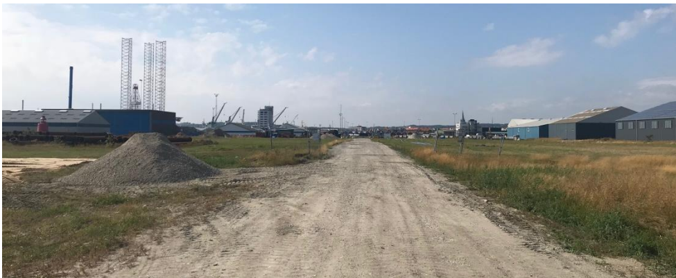
Foto 5. Vestvendt foto fra depotafsnit 4. Vejen er spærret af en aflåselig bom.

Ved depotafsnit 4 var indgangen etableret med bom for afspærring af indkørsel med bil (foto 5). Bommen tilgås med nøgle.