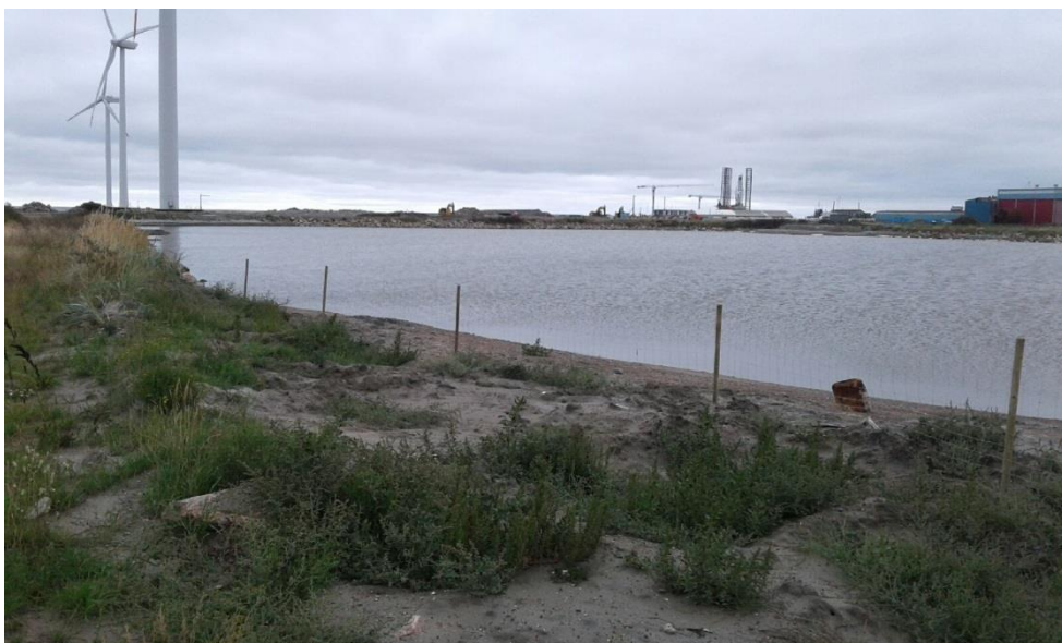
Foto 6, fremsendt den 31. august 2018. Opsat hegn ved depotafsnit 4.