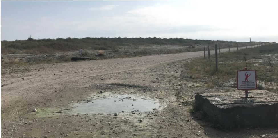
Foto 4. Indgang ved nord-vestlige hjørne af depotet. Ingen afspærring grundet arbejde ved havneudvidelsen.

Ved depotafsnit 4 var indgangen etableret med bom for afspærring af indkørsel med bil (foto 5). Bommen tilgås med nøgle.