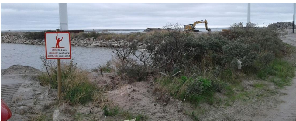
Foto 8, fremsendt den 31. august 2018. Skiltning ved depotafsnit 4

Miljøstyrelsen anser derfor vilkåret for værende opfyldt.