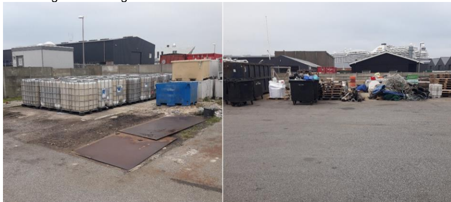
Skagen Havn 12-11-2020

Foto viser, at flere affaldsfraktioner opbevares direkte på pladsen og ikke i containere eller under tag som foreskrevet i miljøgodkendelsen. Skagen Havn skal have opmærksomhed på dette særligt for affaldsfraktioner der kan give anledning til udsivning af forurenende stoffer.