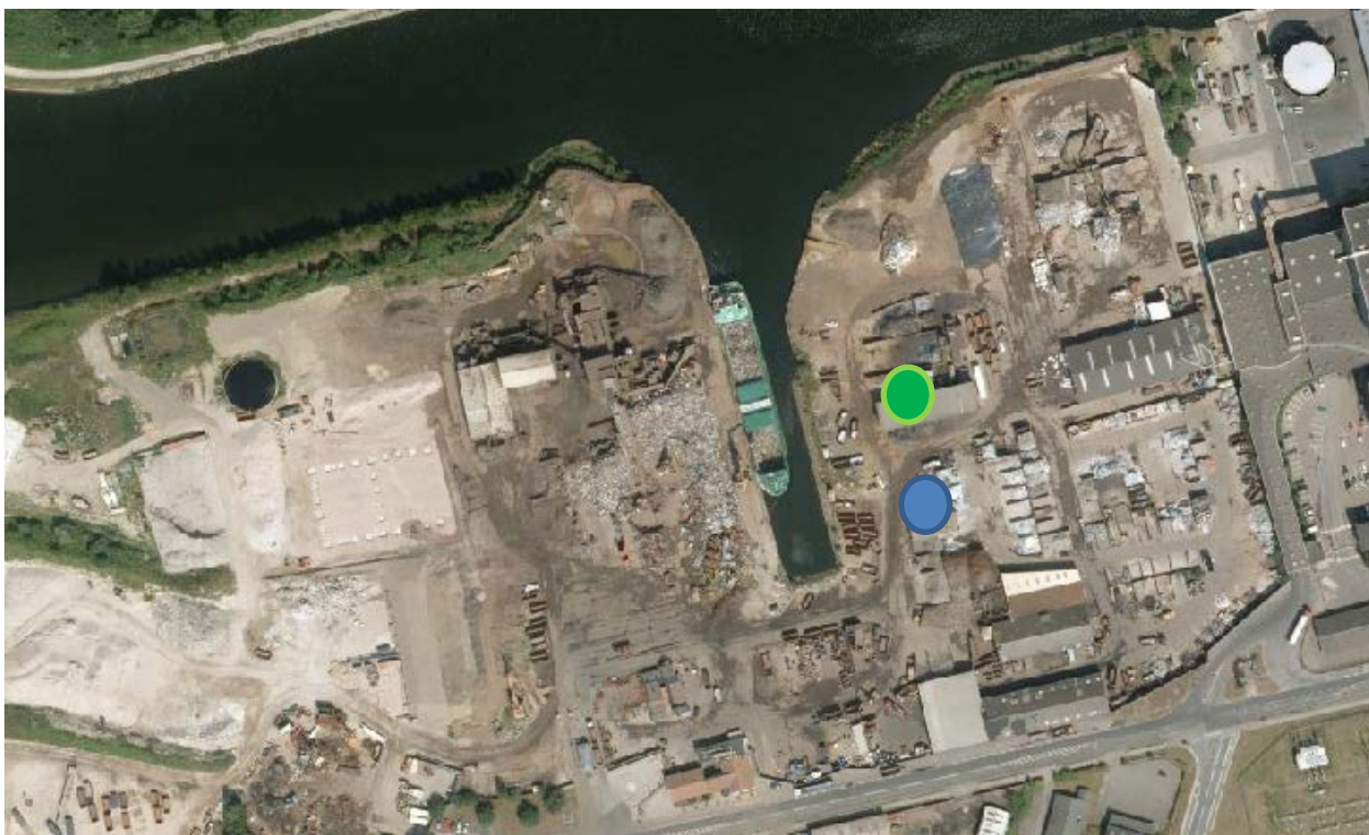
Foto 1: Halvtag til batterier (blå cirkel), Spånhal (grøn cirkel) til opbevaring af spåner med olie.