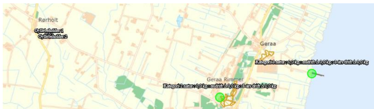
Figur 2. Kategori 1-natur.

Dernæst er det beregnet, hvor meget ammoniak fra husdyrbruget, der deponeres i de nærmest-liggende kategori 1- og 2-naturområder. Naturområderne er vist på kortet i figuren nedenfor.