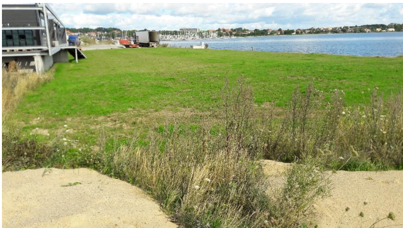
Foto 1. Græsareal forlænget forbi kontorbygning.

Græsarealet nordøst for Vittrup Seafood er forlænget forbi bygningen mod sydøst i et mindre område, se foto 1. Der er fremsendt dokumentation for udlægning af sand og harpet muld i dette mindre område. På den baggrund accepteres dokumentationen for slutafdækningen for dette område.