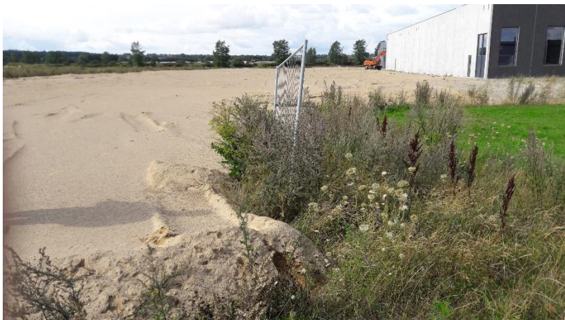
Foto 3. Slutafdækning på området sydøst for bygninger.

Der er udlagt sand fra grusgrav på arealet, se foto 3. Slutafdækningen er ikke ført ud på digerene. Der er to steder udført boringer, der viser, at der er udlagt 50 cm sand. Sand fra grusgrav antages at være rent. Der er fremsendt bilag vedr. levering og betaling af sandet (4.021 m 3 ).