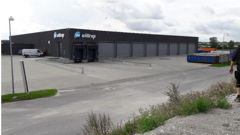
Foto 2. Befæstet område vest for Vittrup Seafoods bygninger.

”Der er udført boringer med jordanalyser. Ud fra analysedata og formodet kote, vurderer Miljøstyrelsen, at nordligt areal + areal med dækningssten er dækket af ca. 50 cm ren jord/dækningssten, og kan betragtes som slutafdækket.”