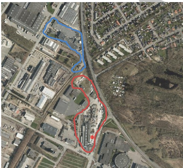
Billede 2: Rød: betonvarefabrikken, blå: A/S Jysk Aluminium Industri