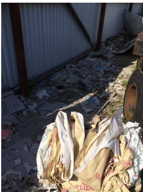
Billede 10: Der er meget pap og papir på jorden inden for hegn

Jf. vilkår 11, gælder det at " Affald, der spildes, skal opsamles samme dag og anbringes i de dertil indrettede containere eller affaldsområder ".