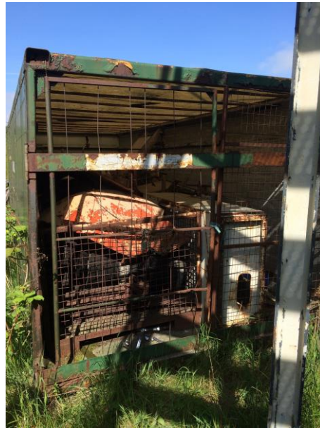
Billede 5: Container med forskellige effekter