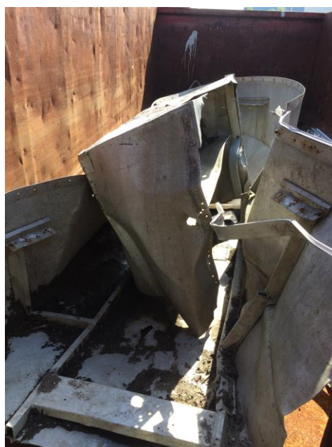
Billed 9: Metalaffald i container