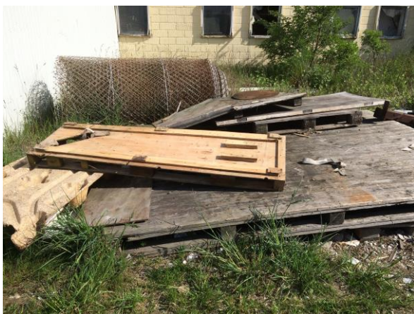
Billede 2: Træaffald og trædækn

Der er dog stadig oplag af forskellige genstande og containere med affald.