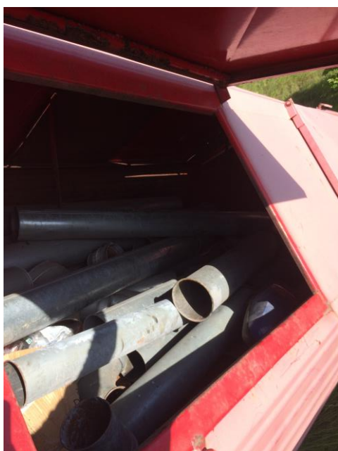
Billede 8: Container med metalrør

Det fremgår af affaldsdatasystemet, at Djurslands Autotransport har afhændet ca. 336 tons jern og metal i 2015 og ca. 360 tons jern og metal i 2016.