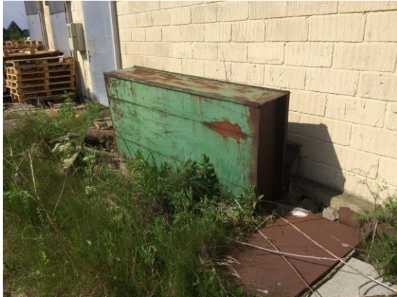
Billede 5: Forskellige effekter af jern/metal