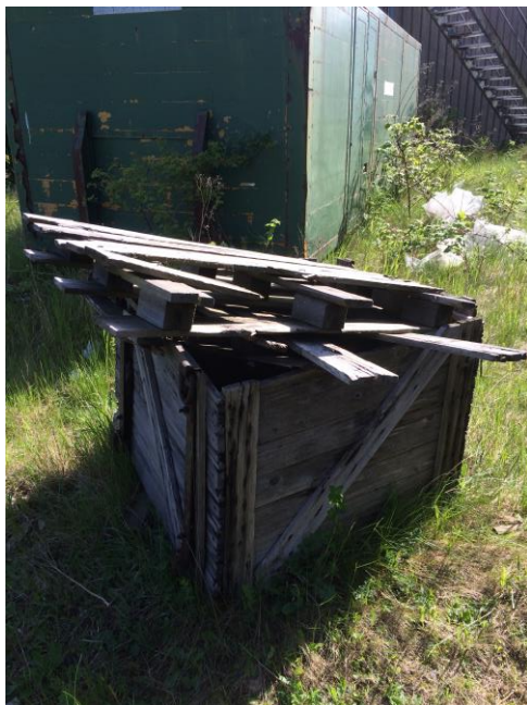
Billede 6. Træaffald.