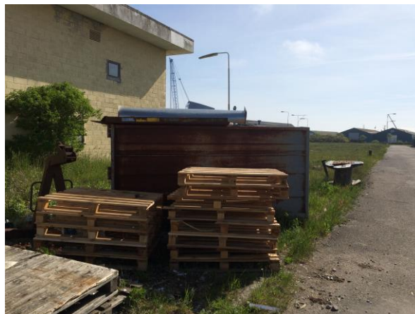
Billede 3: Pallerammer og en container med jern og metal