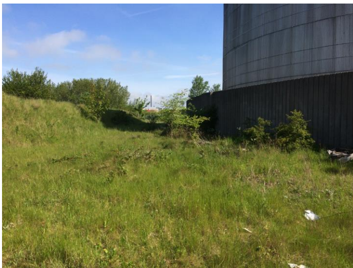
Billede 1. Arealet ved tankgården er ryddet.

Siden sidste tilsyn på adressen, er der sket en oprydning, herunder fjernet stort set alt, som var oplagret bag bygningen, ved siden af tankgården (se billede 1).