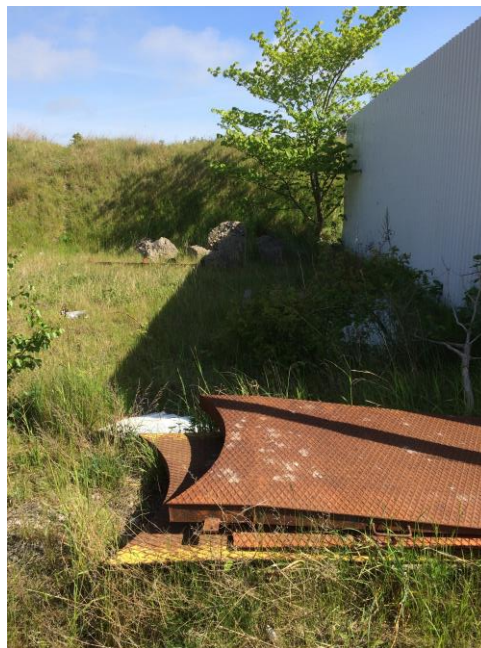
Billede 7. Betonaffald ses på arealet bagerst

Norrdjurs Kommune skal oplyse, at opstilling af containere, der benyttes som en bygning (skur) kræver byggetilladelse. Dette gælder den container der ses på billede 5. Containeren skal enten fjernes eller der skal søges om tilladelse. Evt. byggetilladelse skal søges via det digitale system Byg og Miljø: www.bygogmiljoe.dk