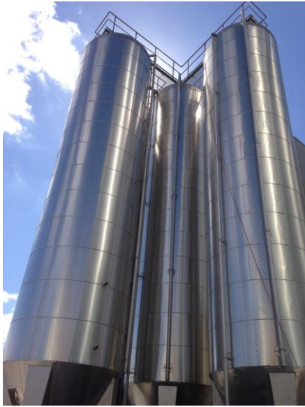
Tanke til flydende råvarer