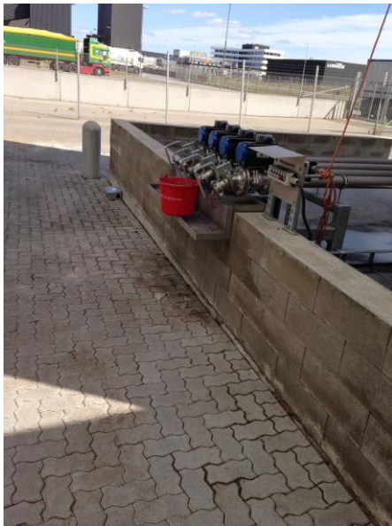
Påfyldningsplads til flydende råvarer.