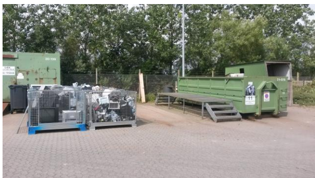
Indretning & drift