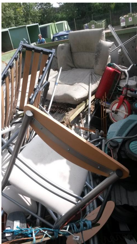
Indretning & drift