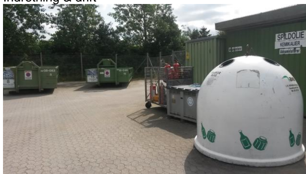
Indretning & drift