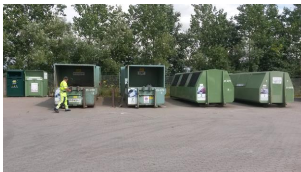
Indretning & drift