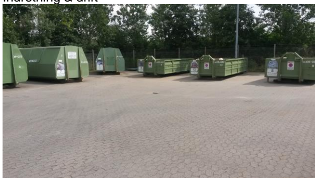
Indretning & drift