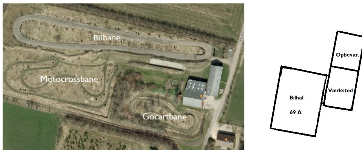
Figur 1: Luftfoto af de tre kørebaner samt indretning af bygningerne.

Baneanlægget består af tre baner; en bilbane, en motocrossbane og en gokartbane. Desuden er der et stuehus (Isbjerg Møllevvej 69 B), en bilhal og et værksted på ejendommen. Bilhallen bruges til opbevaring af biler. Værkstedet benyttes til tankning og reparation (herunder olieskift). Desuden opbevares bocarts, ATV'er, gokarts og motocrossmaskiner i værkstedet (opbevaring). Skitse af anlægget ses på Figur 1.