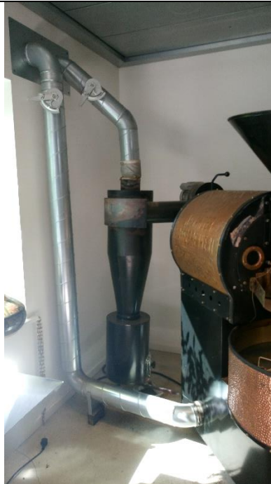
Billede 2: Indsugningsrøret ses forrest og cyklon med udsugningsrøret ses bagerst