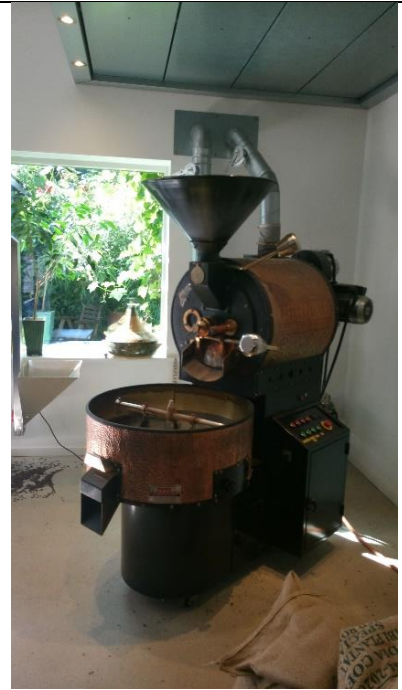
Billede 3: Emhætte i loftet over kafferistemaskinen

Der blev på tilsynet af tilsynsførende bedt om, at virksomheden kommer med en handleplan for at afhjælpe generne hos naboerne. Handleplanen skal indsendes til Syddjurs Kommunes virksomhedsgruppe på virksomheder@syddjurs.dk inden den 15. oktober 2022. Handleplanen vil derefter blive vurderet og hvis tiltagene vurderes, at kunne afhjælpe generne fra udsugning vil der blive stillet krav om, at tiltagene skal udføres.