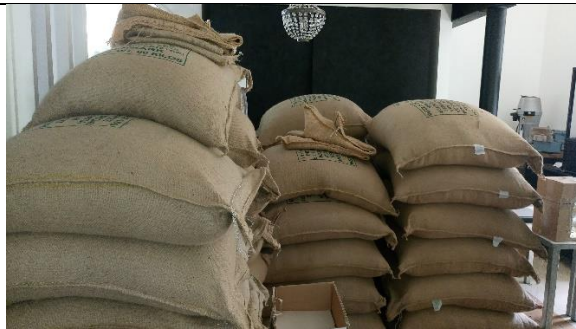
Billede 4: Sække med uristet kaffebønner