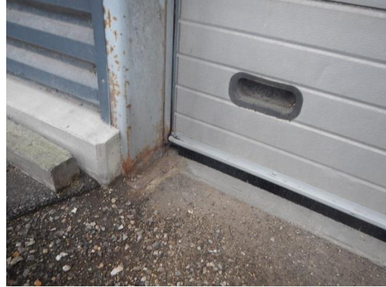
Børster under port gnavet væk (yderst til venstre)

Virksomheden oplever, at det er meget svært at leve op til fødevaremyndighedernes krav til skadedyrsbekæmpelse, og virksomheden risikerer derfor at fødevarekorn må nedklassificeres til foder eller brændsel.