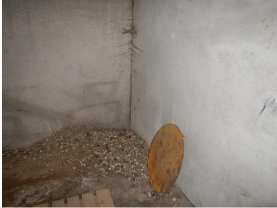
Nylige aktiviteter efter rotter, der har gravet sig under punktfundamentet.

Virksomheden er meget plaget af rotteangreb. Sidebygningen har punktfundament, der gør det muligt for røtterne forholdsvis nemt at grave sig ind i bygningen. Planlagrene har fuldt fundament, men det har vist sig vanskeligt at forhindre at røtterne kan få adgang til plan-lagrene under portene, der nederst er forsynet med hårde børster. Det er virksomhedens opfattelse, at kystlinien umiddelbart vest for vejen, der består af sten, er hjem for mange rotter.