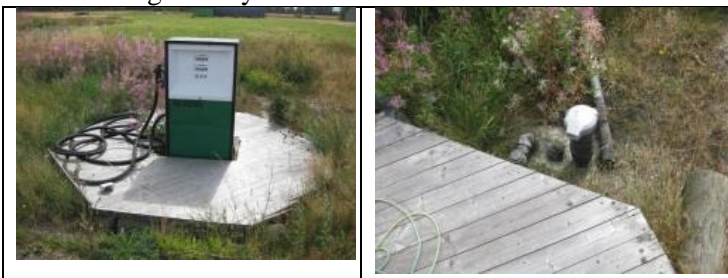
Stander og olietank

24. april 2007 har Struer Kommune udsendt en skrivelse til Lindtorp Flyvecenter vedr. etablering af tankanlægget for flybrændstof.