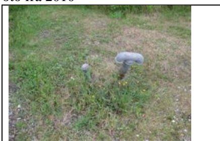
Udluftningsstuds for septiktank