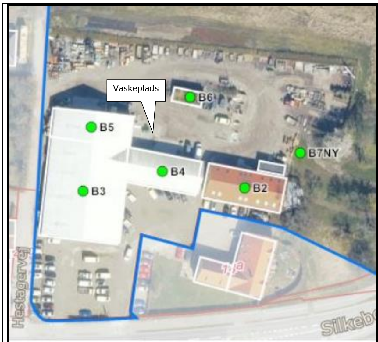
Luftfoto af virksomheden fra BBR med matrikelskel (blå streg)

Virksomheden ligger i henhold til kommuneplanen i et landsbyområde med anvendelse til bolig- og erhvervsformål. Nærmeste boliger ligger vest for bygningerne B3 og B5 kun adskilt af vejen Hestagervej som det fremgår af nedenstående luftfoto med matrikelskel.