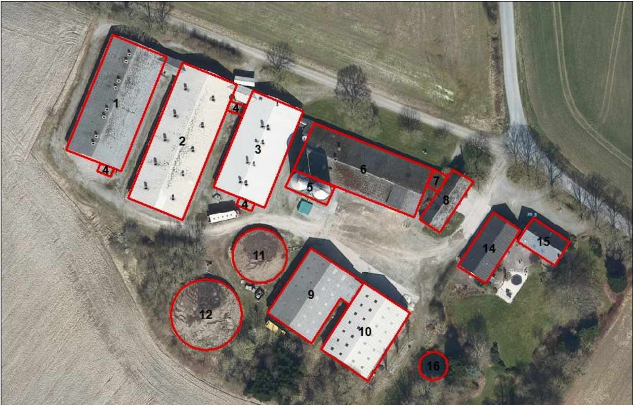
Figur 1a. Husdyrbrugets driftsbygninger på Terpvej 51.