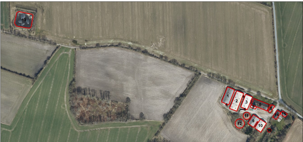
Figur 1b. Husdyrbrugets driftsbygninger og placering af gyllelagune.