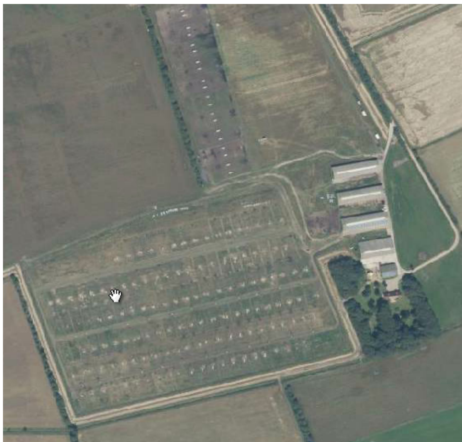
Figur 1. Oversigt over Rømqøvej 61.