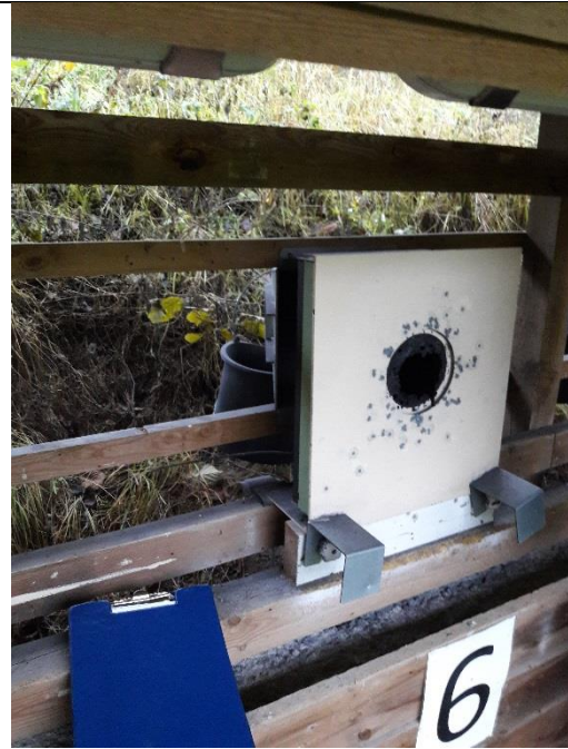
Foto 1 cyklonbanefan ved 50 meter banen