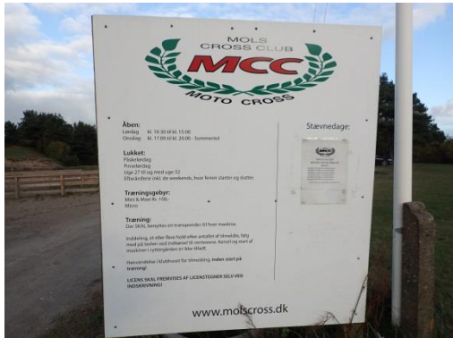
Billede nr. 1: Skilt ved indgangen til crossklubens område.