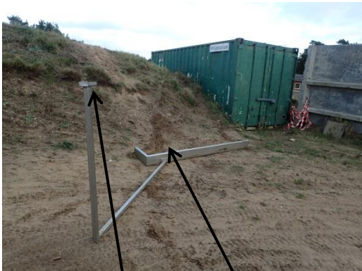
Billede nr. 2 : Anordning der benyttes ved måling af støj fra motocrossmaskiner Placering af støjmåler henholdsvis motocross

Kørere der ønsker at bruge motocrossbanen, skal benytte transpondere, så det er muligt at følge den samlede støjbelastning fra motocrossbanen. Støjbelastningen fra banen ligger normalt langt under støjgrænsen. Hvis støjgrænsen overskrides, stoppes kørsel straks.