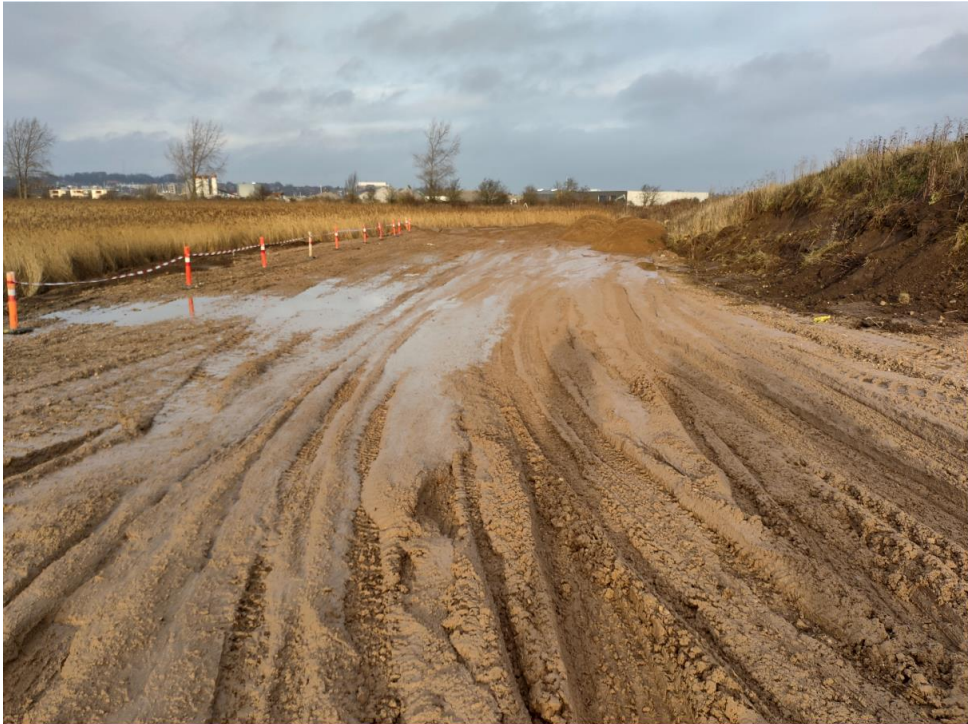
Figur 5 deponeringsfronten var tidligere langs hele den nu afspærrede linje. Nu er deponeringsfronten for enden.