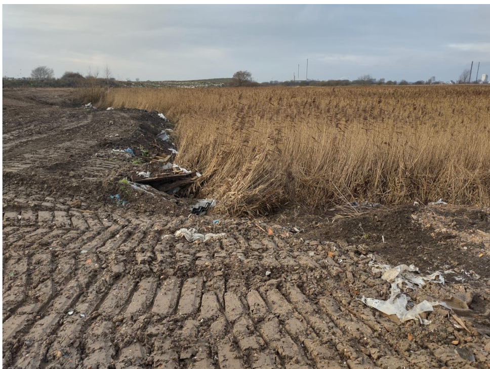
Figur 4 Del af den tidligere deponifront, hvor kanten stadig har blotlagte asbestplader.