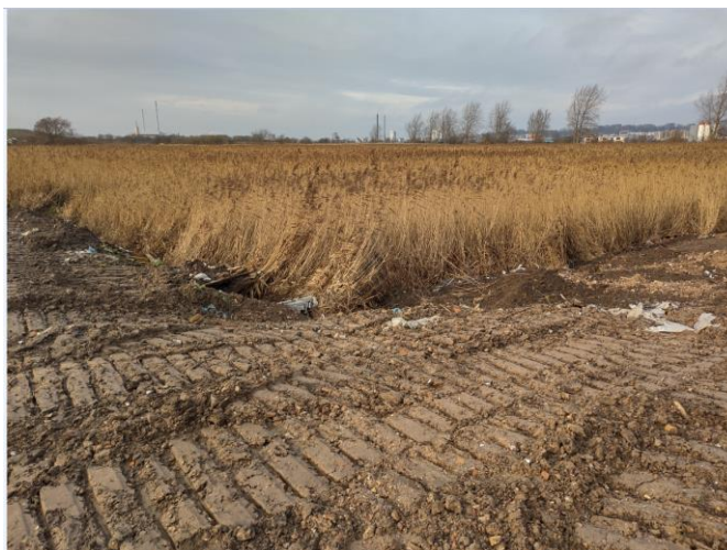
Figur 3 tv. enden af deponeringsfronten, hvor asbestplader på tilsynet den 18. december 2020 ligger synlige og knuste uden at være fuldt afdækket. Th. Del af den tidligere brede front, hvor der fortsat er synlige knuste asbestplader, som ikke er helt afdækket med jord.