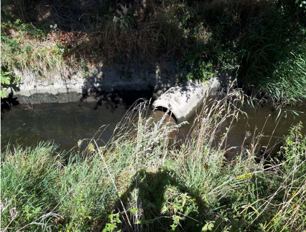
Udløbet, hvor det tidligere er afledt kølevand.