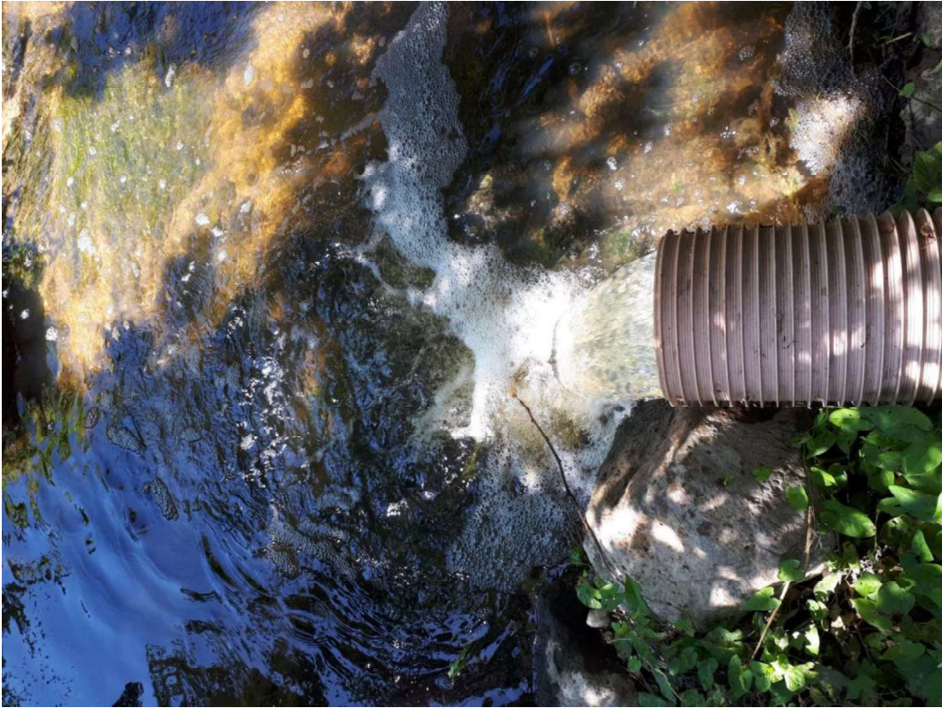
Udløbet fra Harboes renselanlæg til Spegerborgrenden.