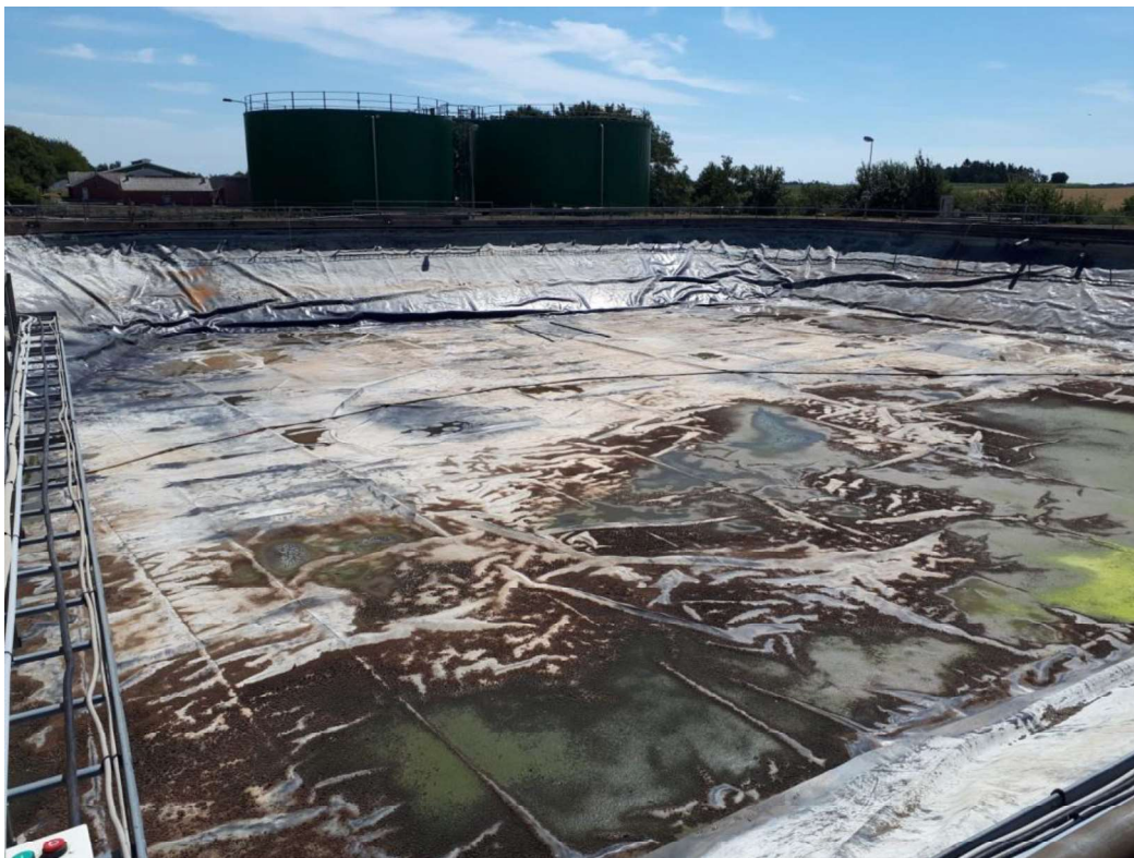
Bassin 1 tømt for slam og vand