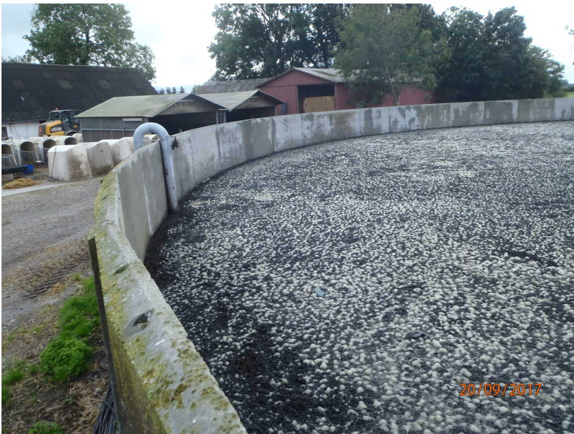
Billede af gyllebeholderen flydelag "ikke tilstrækkeligt"