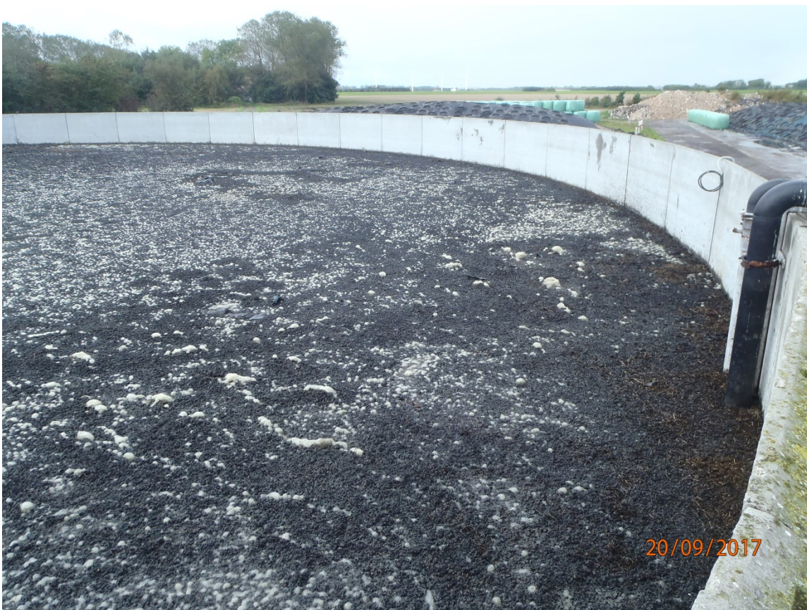
Billeder af flydelaget "ikke tilstrækkeligt"