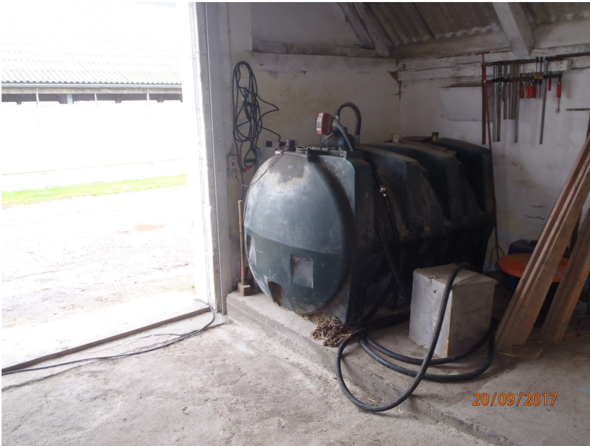
Billede af olietanken