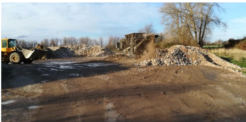
Foto 5 - Stenknuseri