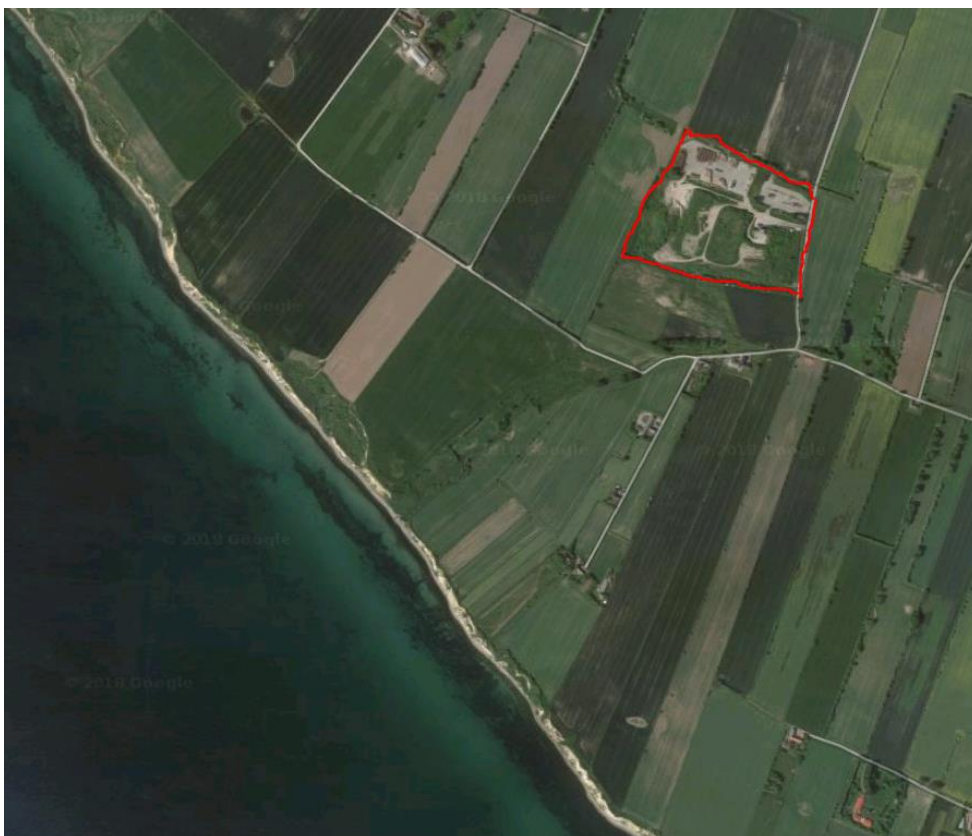
Lokaliteten med Ærø deponi indtegnet med rød streg.