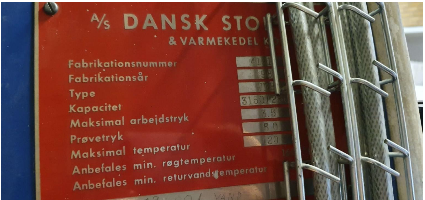
Mærkeplade på kedel 3 - 3150 Mcal/h = 3,66 MW fra 1968. Ikke i drift.