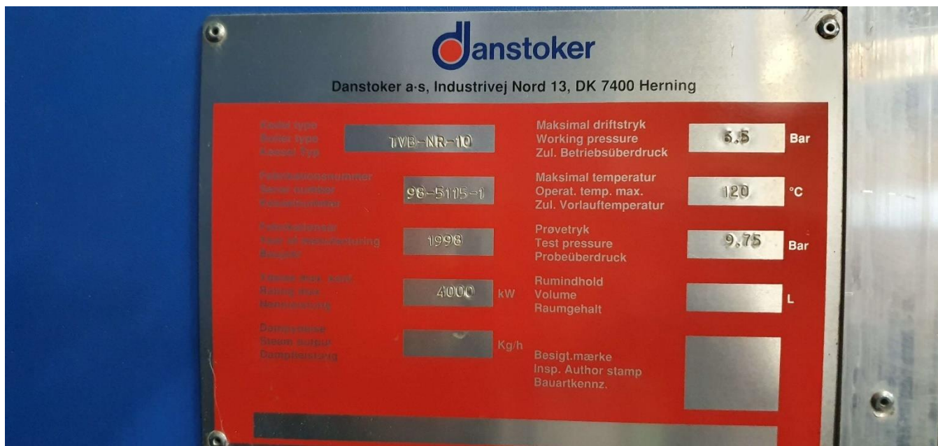
Mærkeplade på kedel 1 - 4,0 MW fra 1998.