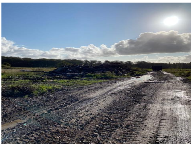
Oplag med træ og container