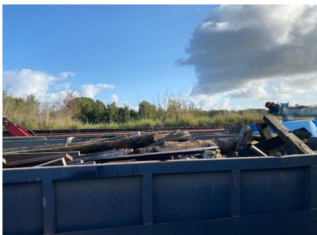
Container med træ i den nordøstlige del