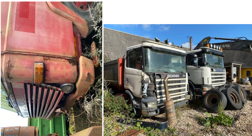
Ikke indregistrerede lastbiler, der skal afleveres til godkendt modtageanlæg