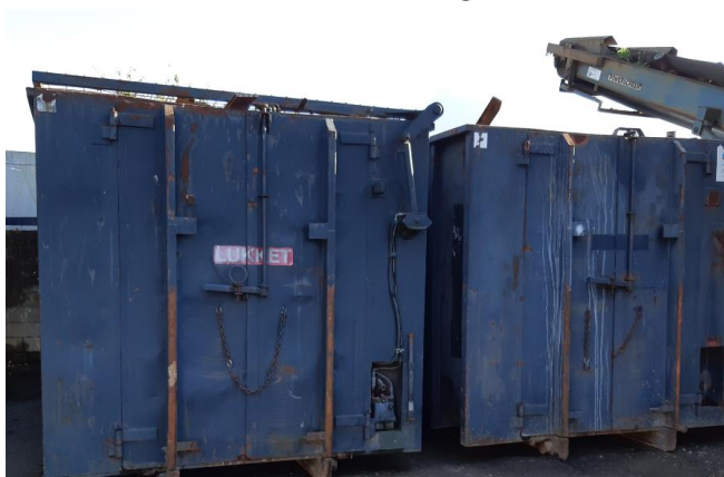
Containere med træ i den sydøstlige del