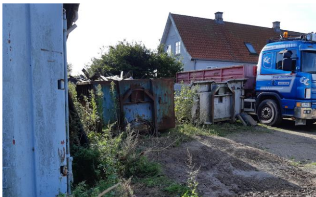
Række med 3 stk. containere med træ