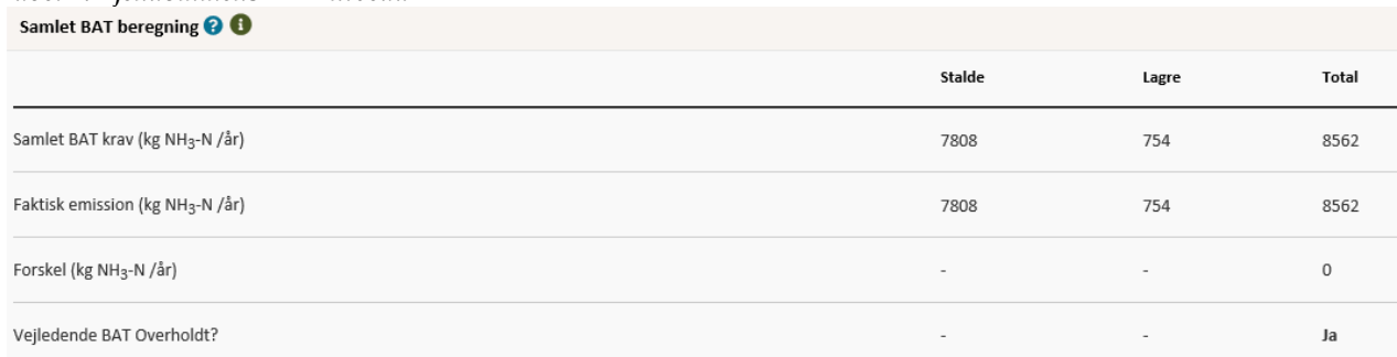
Tabel 1: Ejendommens BAT-niveau

BAT kravet i forhold til Miljøstyrelsens vejledende emissionsgrænseværdier opnåelige ved anvendelse af bedste tilgængelige teknik (BAT) er dermed umiddelbart overholdt. Kommunen vurderer dermed, at der ikke er behov for at stille vilkår om yderligere BAT- tiltag vedr. staldindretning frem til næste revurdering.