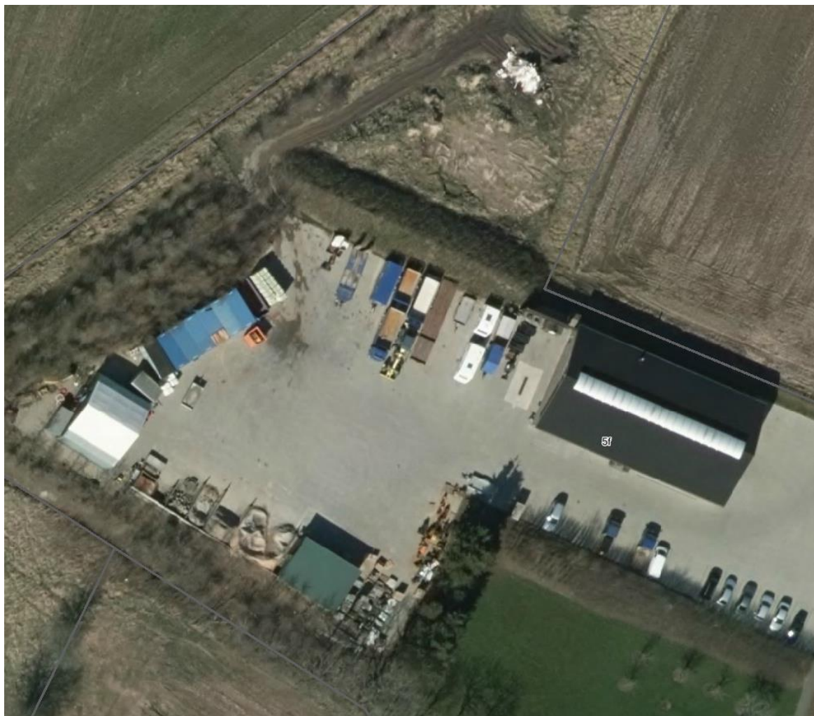
Luftfoto af virksomheden med matrikelskel, anno 2016

Virksomheden ligger i landzone. Nærmeste naboer ligger umiddelbart øst for virksomheden. I henhold til kommuneplanen er områdets anvendelse er fastlagt til jordbrugsformål. Andre arealanvendelser kan dog tillades placeret i området, såfremt de er af uvæsentlig betydning for de landbrugsmæssige interesser, og de i øvrigt efter en samlet vurdering af placeringsmulighederne mest hensigtsmæssigt kan placeres her.