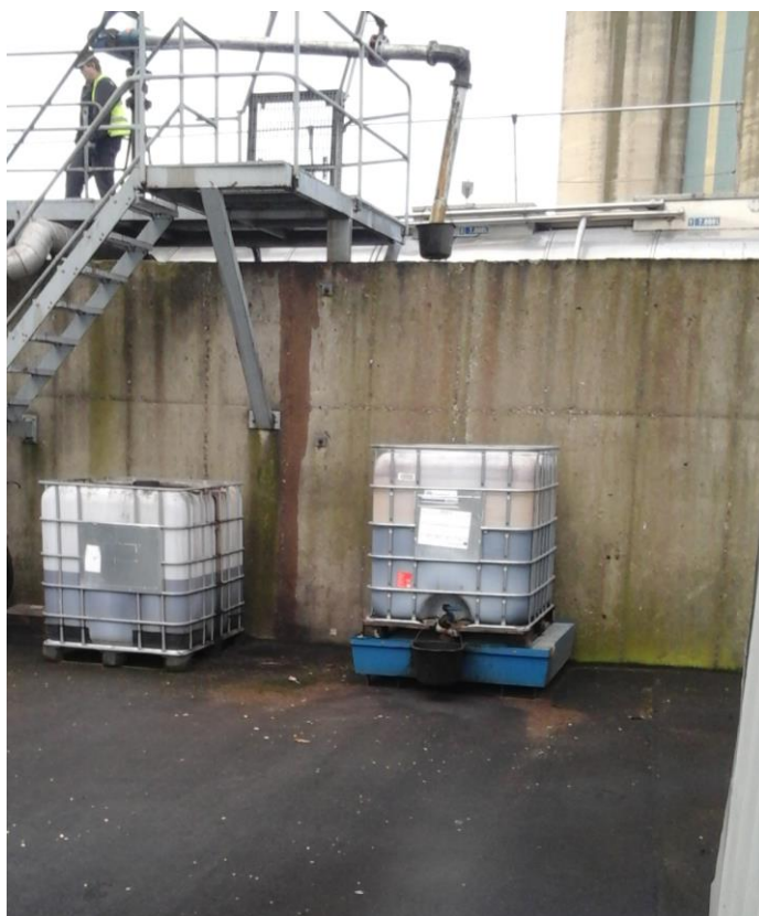
Pallettanke i brug med antioxidant