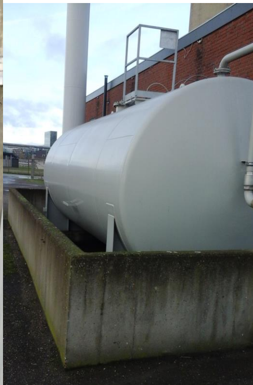
Tank til kedelanlæg