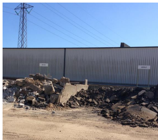
Fig. 2 Oplag af betonaffald og genbrugsasfalt